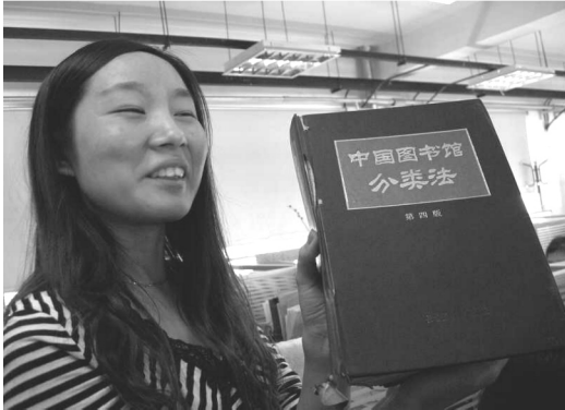
【資料分類的依據：中國圖書館分類法】