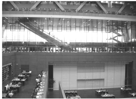
【巨大的玻璃窗後收藏文津閣《四庫全書》】

二期新館，主要包括書庫、閱覽室、研究區、藝術區、《四庫全書》存放展示區、學術交流區及數字共享空間等數十個不同功能的區域。以下係為參訪過程中，令人印象深刻之特色服務：(相關參考資料來源： http://www.nlc.gov.cn/ )