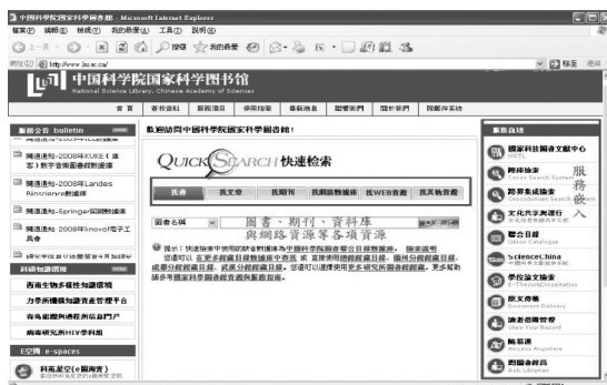
【中間的 Quick Search 將圖書、期刊、資料庫與網路資源全部一網打盡；右邊就是服務嵌入，隨手可得】

無論是詢問館員、跨庫檢索、文獻傳遞、E 划通、隨意通（校外連線）等服務，皆可使研究人員方便、快捷的透過網站，獲取所需的資訊和服務。（如右圖）