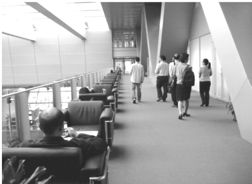
【隨處可見的讀者座位】