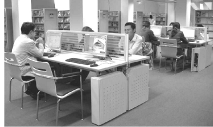
【隨處可使用的電腦設備】

(4)無線網路覆蓋整個館區，上網方便。自行攜帶電腦者，可於任何角落（甚至是室外活動區）享受圖書館所提供的網路服務，以便獲得最新資訊。亦可在數位共享空間或其他區域利用館內電腦上網，其提供第一個小時免費，超時則每小時收取人民幣3元的服務。