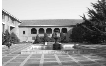
【1919年完成之新館與老館，相互呼應、渾然一體，紅磚牆、坡瓦頂、拱門窗】

館內的多媒體學習中心，以開放舒適的服務為主要特色；不但提供豐富的影音資源，更可以多媒體資源與服務平台來觀看。其中包含學術講座(中外名著、小說、科學與人文等)、學習參考資料(講座視頻與網絡培訓教程)、語言學習以及經典影視、音樂、戲曲等；視聽欣賞區亦配備大螢幕電視，以提供讀者欣賞電視節目、觀看學術報告以及聆聽音樂的空間，使學習之餘也可享受視聽休閒。