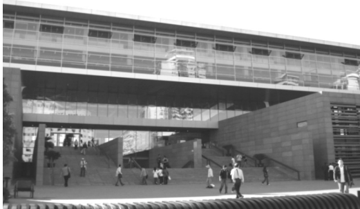
【中國圖書館新館正前方入口處玻璃帷幕】

此次筆者參訪 2008 年 9 月 9 日才開幕啟用的新館(國家圖書館二期新館)。該建築結合了巨型鋼結構與挑高的四方中庭設計，以高大的玻璃帷幕接收自然光照，讓室內更加明亮，亦使整棟建築更符環保節能原則。主樓地下 3 層，地上 5 層，讀者座位達 2,900 個(隨處可見的坐椅，盡可能為讀者提供舒適的閱讀空間)，使接待能力增為每日 8,000 人次。