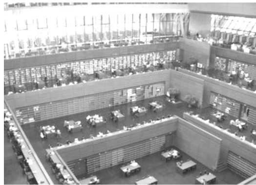
【閱覽大廳(中庭式的設計，挑高樓層，氣勢非凡！)】