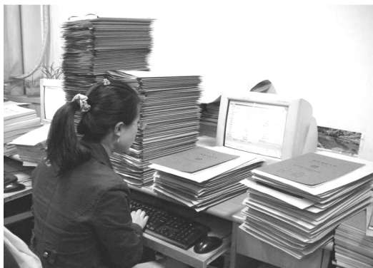
【收到資料後要先登錄，再分送】

雖然工作單調枯燥、技術門檻低、流動性也大，但工作效率依舊相當驚人，平均年產量達 500 多萬篇期刊、180 萬篇報紙、20 萬篇博碩士論文、1 萬多本會議論文及工具書，資訊處理能力更達 5 億條。生產周期相當快速(指資料進到加工基地到線上發佈：期刊 5-6 天、會議論文 3-4 天、博碩士論文 5-10 天、引文 1 天)，以保證 CNKI 系列資料庫的出版品質與出版週期。