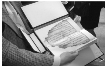
【修補裱補後的焚餘書】