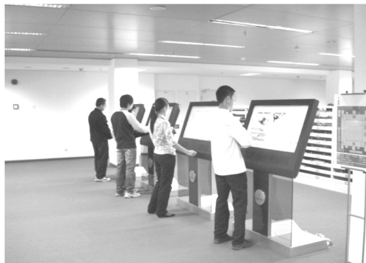
【報紙閱覽室內一排的觸摸式終端機，隨時都有讀者在使用】

(3)數字共享空間服務 (Information Commons)。圖書館為滿足讀者對空間、服務的需求，特地營造一數字資源環境；不但提供電子報刊、電子書及學位論文等 10 餘種共 130 餘個中英文資料庫，並有圖書館自行數位化的 3 萬餘種影音資料與 2,000 種多媒體光碟資料。