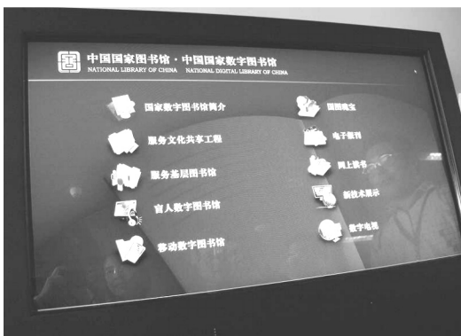
【觸摸式電子資源服務-讀者可直接閱覽館藏古籍、電子報紙等數字資源】

(2)觸摸式電子資源服務。包含國圖數字圖書館簡介、國圖瑰寶、共享工程服務、電子報刊、數位電視等 10 多個項目。其中最引人矚目的，就是電子報刊服務(含人民日報、北京日報、北京晚報、東方早報、京郊日報等10餘種報紙)，讀者只要輕撥手指，即可點選所要看的報紙，無論是翻頁、放大、縮小、定位、快速導航等皆十分新奇有趣。全館除有 10 台同型機器可供讀者使用外，入口處亦設置一台以便民眾體驗。