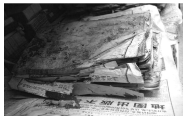
【戰火中搶救下來的焚餘書】