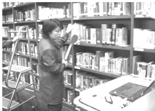
【工作人員正利用RFID在進行盤點及歸架作業】

(2)觸摸式電子資源服務。包含國圖數字圖書館簡介、國圖瑰寶、共享工程服務、電子報刊、數位電視等 10 多個項目。其中最引人矚目的，就是電子報刊服務(含人民日報、北京日報、北京晚報、東方早報、京郊日報等10餘種報紙)，讀者只要輕撥手指，即可點選所要看的報紙，無論是翻頁、放大、縮小、定位、快速導航等皆十分新奇有趣。全館除有 10 台同型機器可供讀者使用外，入口處亦設置一台以便民眾體驗。