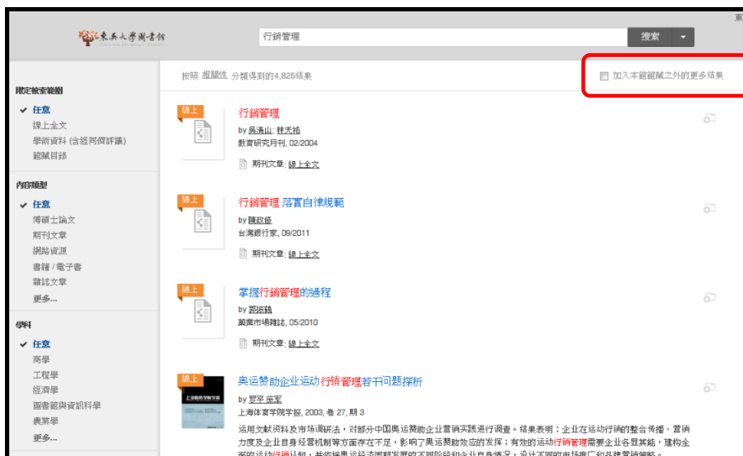
【圖 2 提供延伸館外查詢】

資源探索服務系統(Summon)，提供查找電子文獻及館藏資源，只要是學校所購買之紙本館藏、電子期刊、資料庫、機構典藏等，均可一次查找，並提供延伸館外查詢，除了檢索預設查詢的範圍外，也同時檢索圖書館沒訂購的其他資源(期刊、電子書、專利、機構典藏、政府報告等近 100 種文獻類型)。這部份資源有可能取得全文，也有可能僅提供參考文獻。