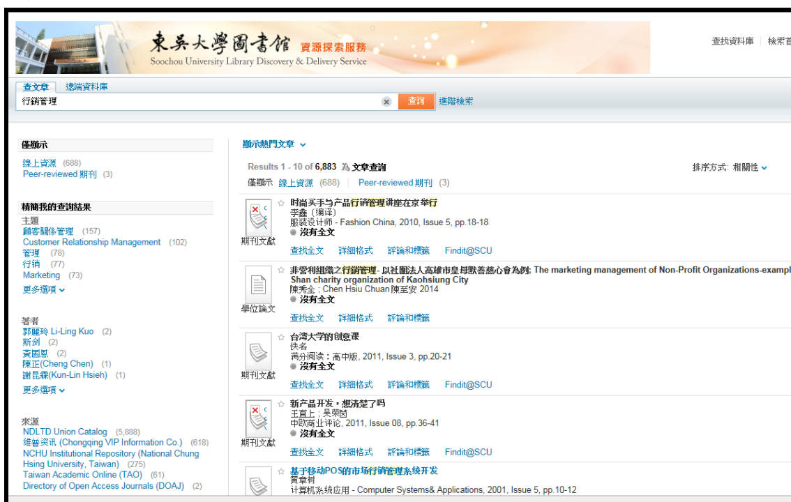
【圖 3 提供不同類型資源一次查找】

目前資源探索服務系統(Primo Central)，提供期刊文章、評論、新聞、報紙文章、會議論文、電子各類型資料查找。