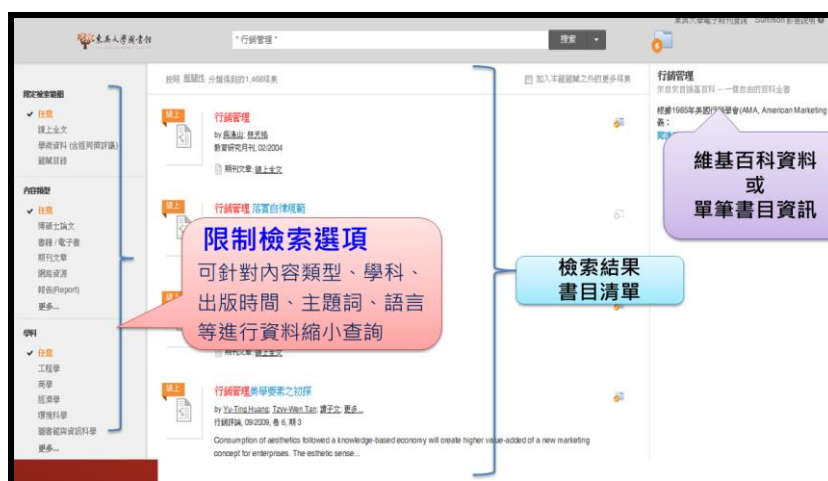
【圖 4 Summon 查詢結果畫面】

輸入查詢詞彙後，查詢結果頁面分為三欄，左欄依據查詢結果做後分類群組，透過後分類，可進一步篩選縮小查詢結果範圍，後分類的類別包括「資料類型」、「學科」、「出版時間」、「主題詞」、「語言」等，而中間欄位則會顯示查詢結果書目清單，右邊欄位則會根據你鍵入關鍵字顯示維基百科中的說明及單筆書目的相關資訊。