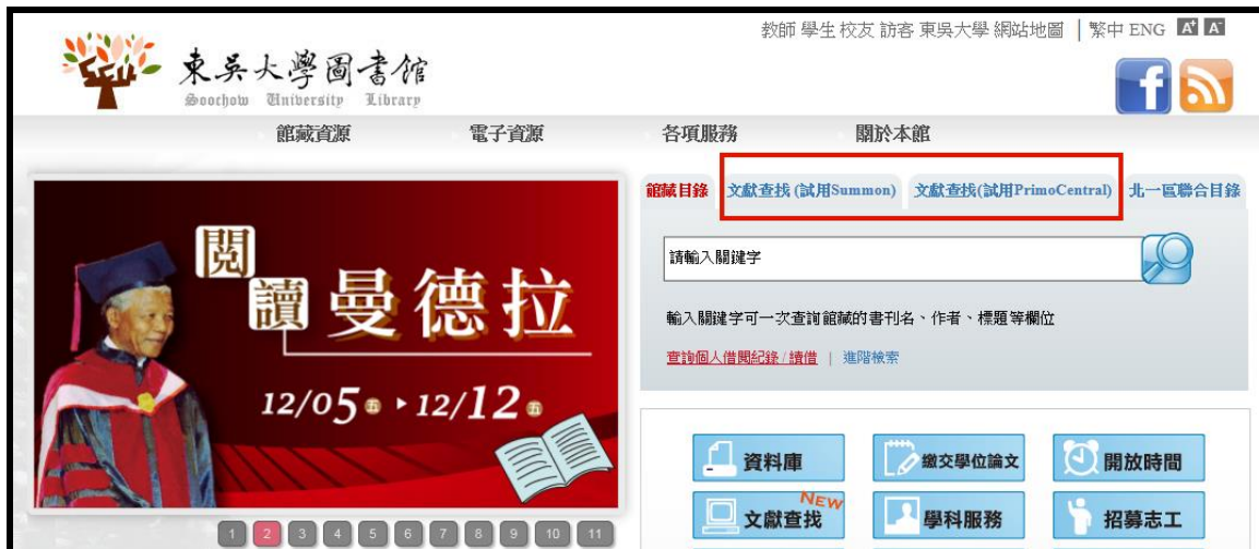
【圖 1 圖書館首頁提供試用資源探索服務】

本館今年 9 月份起提供師生試用查找文獻新利器--【資源探索服務】(兩套 Summon 及 Primo Central 系統), 相信大家對此新系統一定感到新奇, 跟圖書館其他資訊檢索系統有何不同? 本期館訊將進一步帶領您了解新服務——「資源探索服務」(Web-scale discovery Service)。