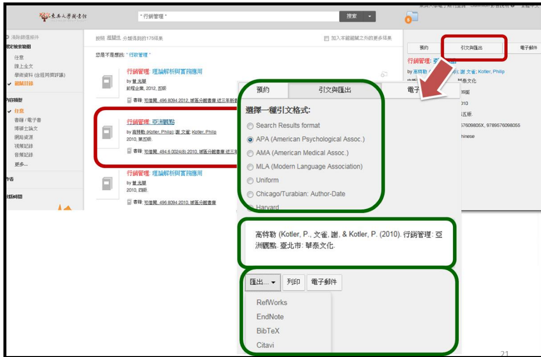
【圖 6 Summon 書目匯出】