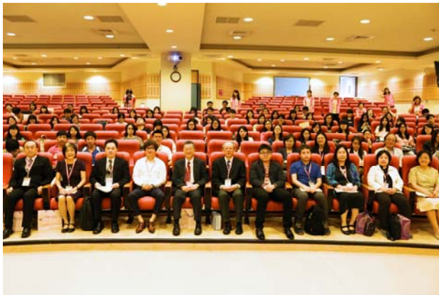
【所有與會貴賓合影】