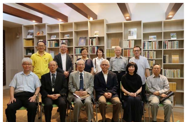
【與會貴賓與陶晉生院士合影】

◆6月26日(一)召開105學年度第21次主管會議，討論105學年度圖書館整體滿意度問卷調查結果、是否與國立臺北商業大學學生社團「綜合知識經濟研究社」合作推廣閱讀計畫及確認「2017 雙城記-圖書館陪您走第1哩路」新生活動等事宜。