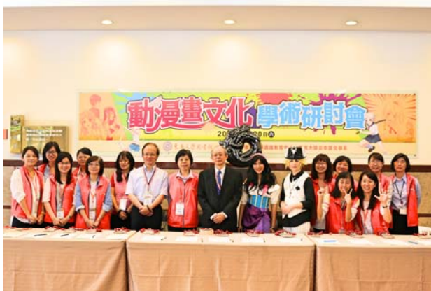
【全體工作人員合影】