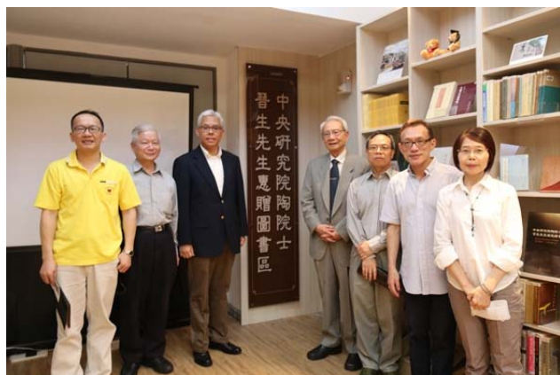
【歷史系教授們與陶晉生院士合影】