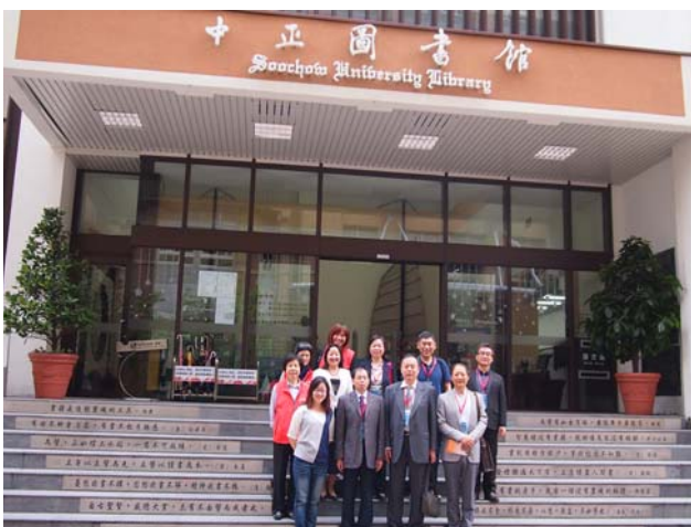
【山東高校圖書館參訪團蒞館參訪】