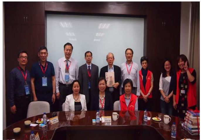
【山東高校圖書館參訪團座談會合影】