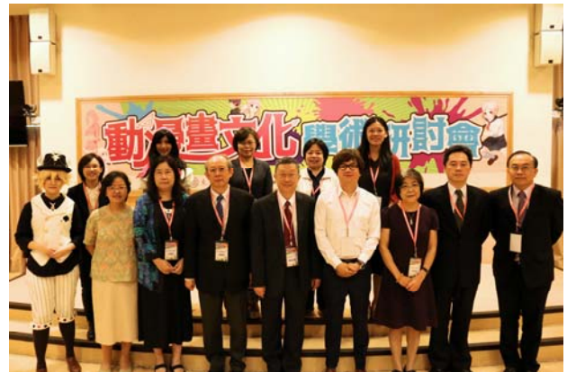
【貴賓與論文發表人合影】