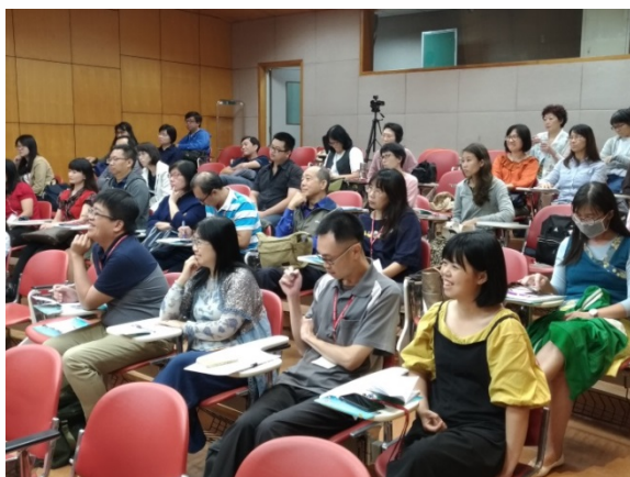
【圖書館同道參與情形】