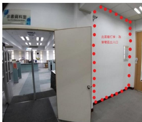
【圖 1 非書資料室內一隅（左），室外筆電區範圍（右）】

新設置的筆電區主要提供讀者進行數位學習使用，配置 14 席位，每個座位都有專屬的電源插座。同學若有時間，不妨來筆電區坐坐，在暖色燈系的圍繞下，享受坐在高腳椅上的閱讀氣氛（圖 2、圖 3）