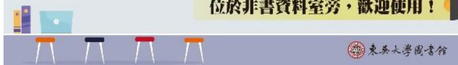
【圖 4 城區分館筆電區使用須知】