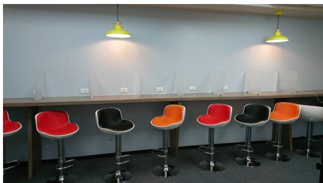
【圖 2 考量防疫需求，每個座位都設置壓克力隔板】

但本區的席次仍屬有限，同學需配合遵守「筆電區使用須知」（下頁圖 4），如筆電區以攜帶數位閱讀載具之使用者優先使用，一人限一位（筆電區座位實景圖如圖 5、圖 6）；禁止使用延長線或轉接插頭等。