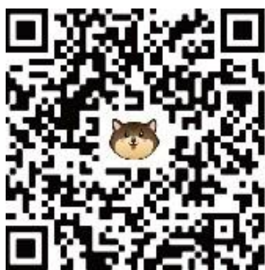
【AR 漫讀 QR Code】

潘維大校長表示，本次圖書館的創新改革，是將以往被動式的學習轉變為互動式體驗學習，可以有這樣的改革要感謝圖書館委員會的大力支持。在與 Cheap 合作拍攝短片後，潘校長打趣的表示，若有機會當網紅，想要當歷史型 Youtuber！現場除了校長示範直播外，董保城副校長與趙維良副校長，也搶先體驗攝影棚，親自拍攝小短片來介紹圖書館漫讀區以及攝影棚，鼓勵大家可以多多利用圖書館的資源。