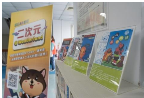
【校狗太郎 AR 宣傳看板與絕版漫畫介紹立牌】

本校的漫畫館藏量及面積居全臺大專院校圖書館之冠，保存許多珍貴及絕版漫畫。其中，趙維良副校長也慷慨捐贈所珍藏之漫畫，包括陳海虹的武俠漫畫《小俠龍捲風》及葉宏甲的臺灣英雄偶像《諸葛四郎》系列。為了讓更多師生能感受漫畫的魅力，圖書館以 4 樓漫讀區為主體，繪製 3D 立體場景導入 Spark AR 技術，只要掃描 QR Code，即可與虛擬的校長、東吳校狗太郎等人物互動，並且可透過創意濾鏡，躍身為漫畫封面主角及製作屬於自己獨特的漫畫。