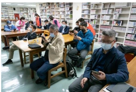
【一、二級主管實際操作 Spark AR 技術】