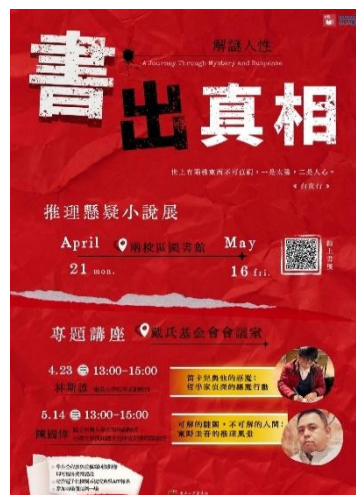
【圖 1 活動主海報】

2025 年世界書香日，本館特以「推理懸疑」館藏為主題，於 4 月 21 日（一）至 5 月 16 日（五）舉辦推理與懸疑小說書展及系列講座。通過書展與講座雙軌並行的形式，深入探討推理作家筆下的人性幽光、社會百態與倫理困境，並特別聚焦「推理」本身——作為一種不可或缺的思維能力與精妙的敘事藝術——其獨特價值與魅力。