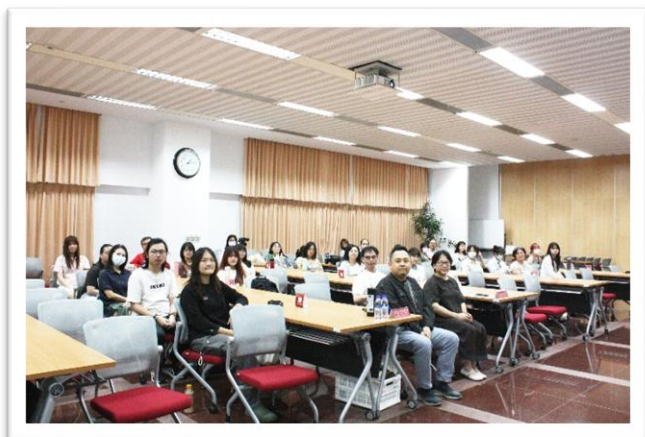
【圖 7 講座合照】