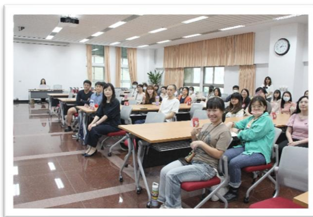
【圖 5 講座合照】