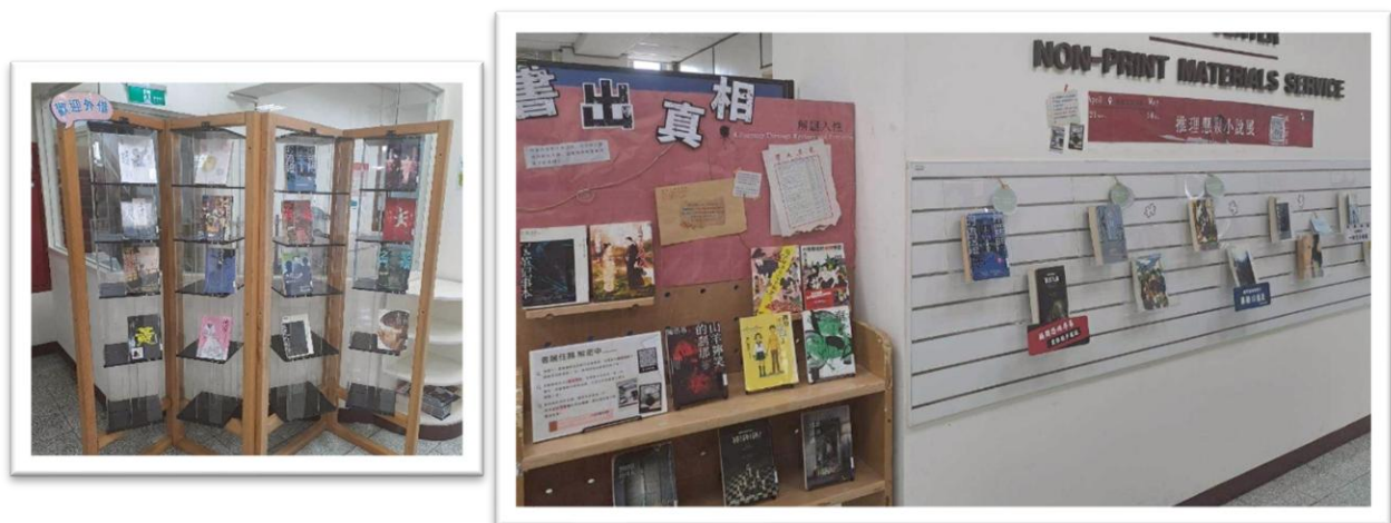
【圖 3 城中校區分館展區】