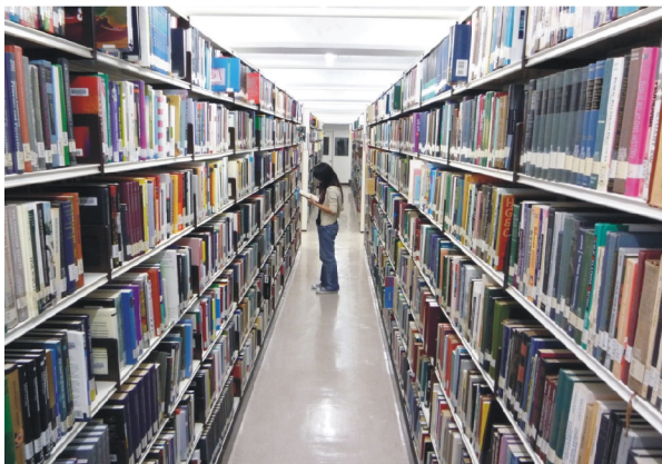
佳作 題目：獨享浩瀚書海 林宛萱 東吳大學國貿系

我們用一種舒服的姿勢躺下，細細品嚐著對書的迷戀與嚮往。我想，也只能把這一瞬間的凝結裝進小小的相片裡，才足以說明我捨不得遺忘的眷戀吧！