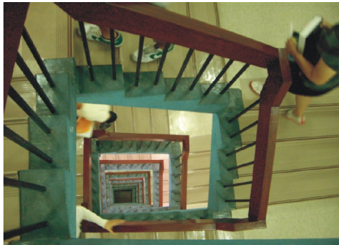
佳作 題目：萬梯尋書 康立孝 東吳大學哲學系