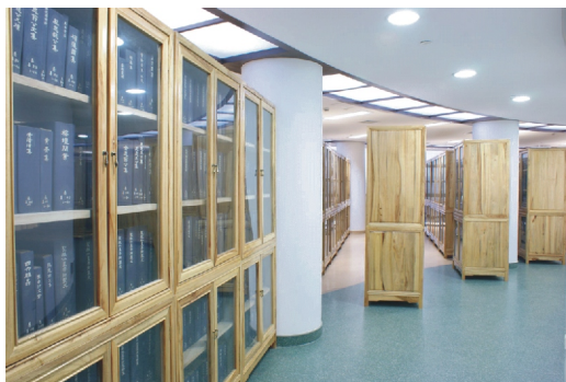
【華師大圖書館古籍書庫】