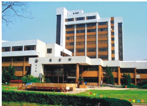
【華東師範大學圖書館_舊館】

華東師範大學圖書館，創建於1951年10月。現由閔行校區圖書館和中山北路校區圖書館組成，館舍總面積約5.6萬平方米。印刷型文獻總量380萬冊，其中期刊合訂本32萬冊，線裝古籍約32萬冊。此外，網路資料庫81個（含209個子庫），其中電子期刊2.85萬種，電子圖書112萬種，學位論文89萬餘篇。