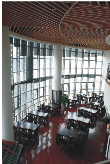
【華師大圖書館古籍閱覽室】