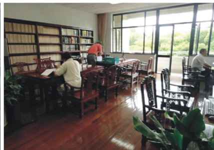
【古典式的家譜閱覽室】

閉架式的書籍，由讀者在索書區查尋後送出借閱需求，書庫管理人員找到書後將書放置自動索書機上，書籍則會藉由軌道運行到櫃台供讀者借閱，非常便利（如下圖所示）。