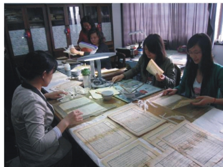
【研究生協助簡易修復】