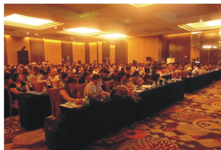
【「多媒體數字資源建設與服務國際研討會」規模宏大、專家雲集】