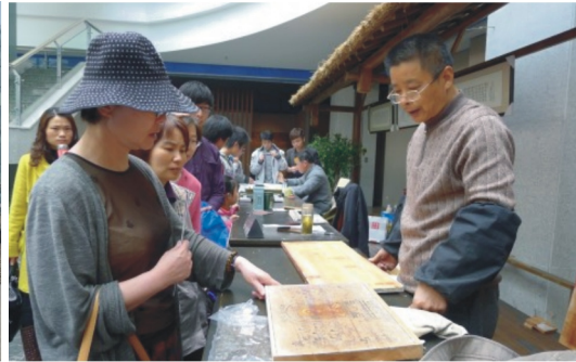
【觀賞工藝家現場示範雕版印刷過程】