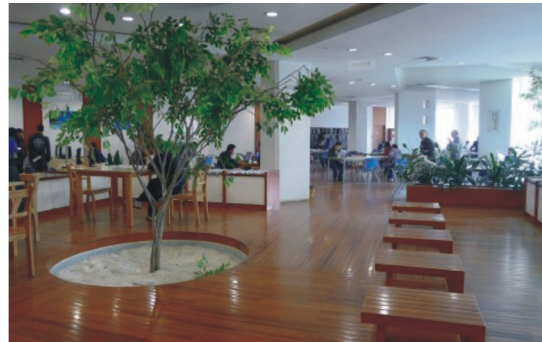
【蘇州圖書館報刊閱覽室】