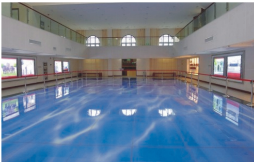
【蘇州大學博物館在原司馬德游泳池上貼水波紋磁磚以保留風貌】

以一個大學之力能搜羅如此多的稀珍文物，著實令人佩服。另外，館方在空間營造、主題規劃及資訊科技的運用，讓人留下深刻印象，讓觀者與藝品的距離拉近，強化了觀賞展覽的深度。蘇大博物館不僅展現蘇大百十年文化底蘊，也在保存文物展品的同時，成為該校學生文化美學教育的場所。