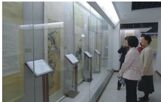
【參觀蘇州大學博物館內的名家字畫】