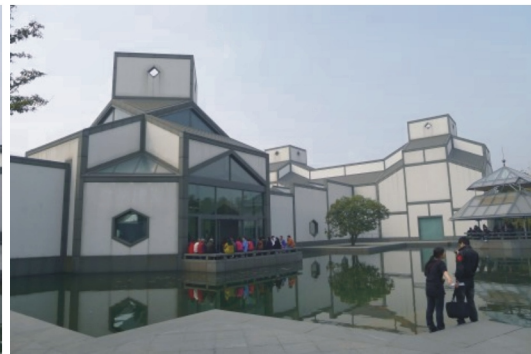
【蘇州博物館幾何造型外觀】