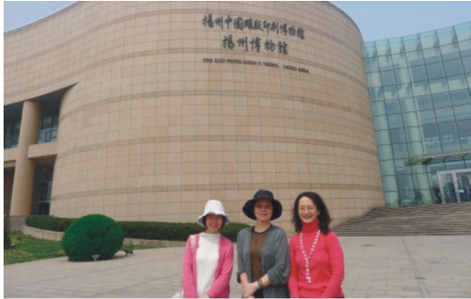
【揚州中國雕版印刷博物館外觀】