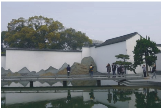
【蘇州博物館片石山水園】

走進這座以幾何平面造型結合中國傳統庭園意象的博物館，能夠體會到融匯中西、貫通古今的古典園林新意。新館色調以傳統的粉牆黛瓦為基本元素，在錯落有致的建築布局中，與白牆搭配，清新雅致。在採光上突破中國傳統建築，以玻璃及鋼結構讓室內借到大片天光。意在將自然光引入活動區和展區，讓參觀者能透過玻璃屋頂看到天空與白雲。新館透過庭院綠地、水面、漏窗、竹子、片石假山等園林元素營造出豐富多變的視覺空間，也給我們未來在圖書館內部空間改造上不少啟發。