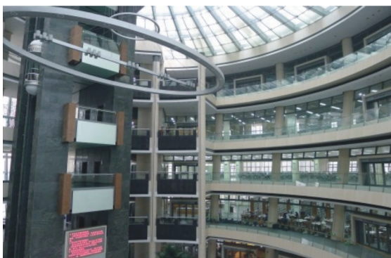
【蘇州大學炳麟圖書館內部空間】