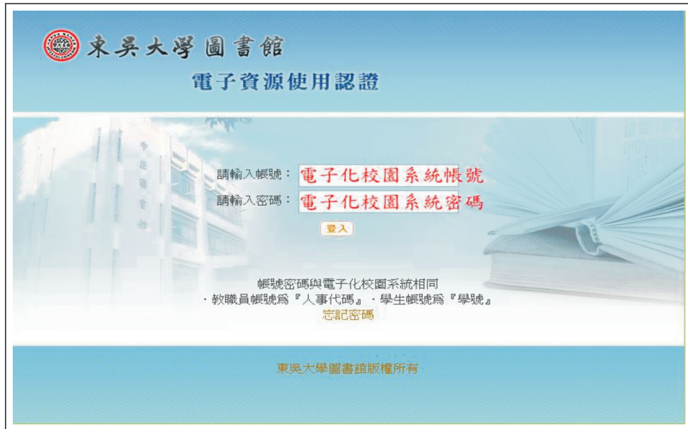
【圖1.2：輸入電子化校園系統帳號與密碼】