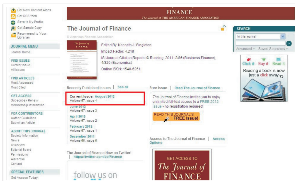
【圖2.6：進入目次頁後即可選擇所需之卷期】