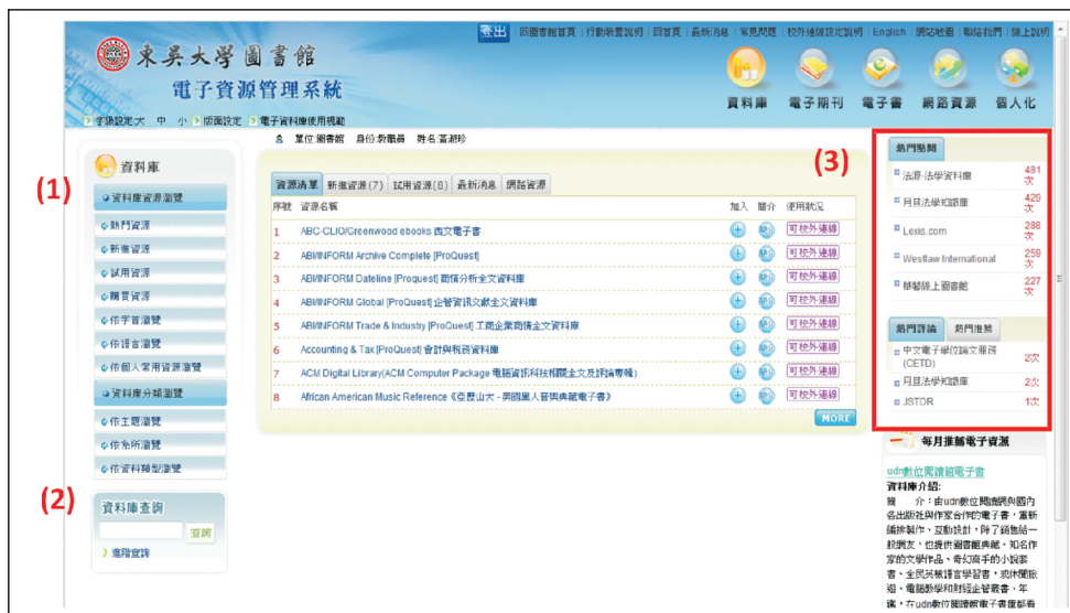
【圖1.3：三種進入資料庫之方式】