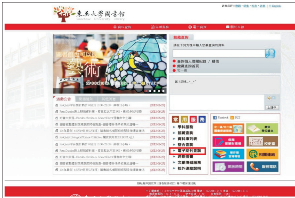
【圖2.1：點選「電子期刊查詢」系統】