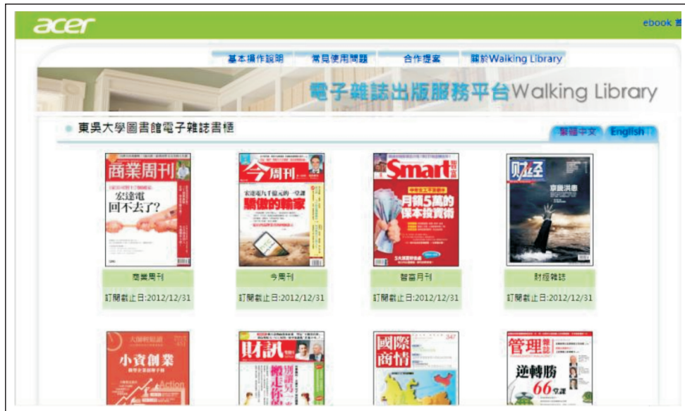
【圖1.6：進入電子雜誌出版服務平台（Walking Library）】

6. 點選資源網址後，即進入電子雜誌出版服務平台（Walking Library）。