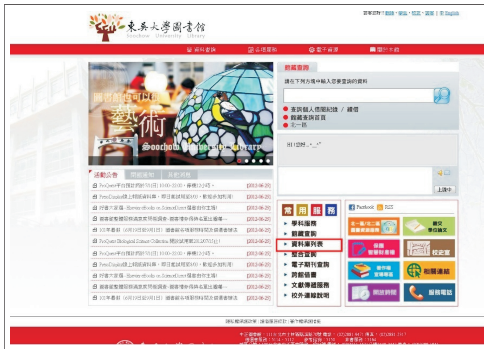
【圖1.1：點選資料庫列表】