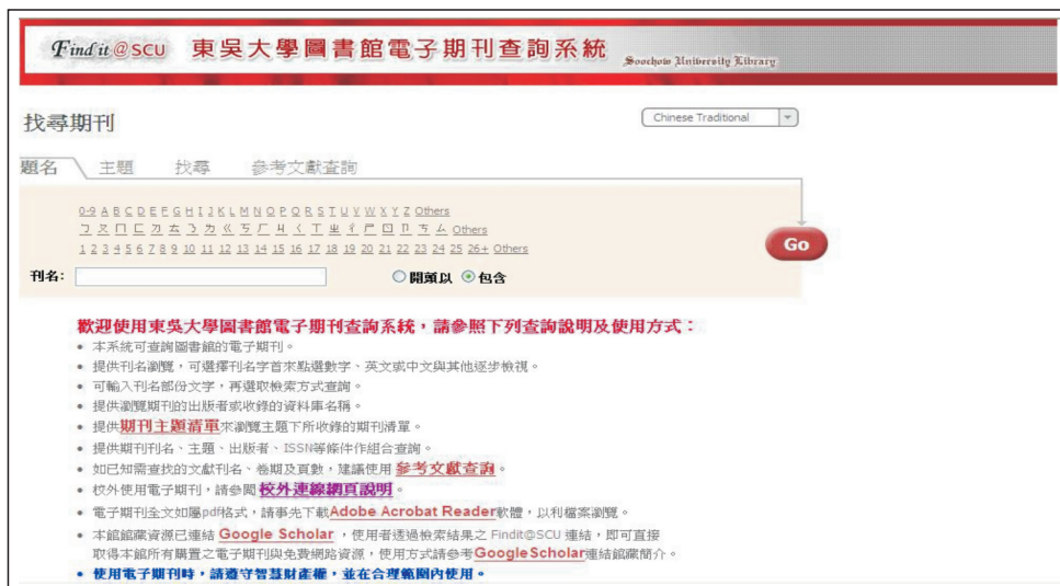
【圖2.2：進入電子期刊查詢系統】