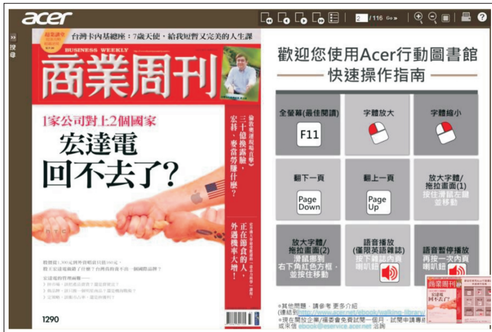
【圖1.7：點選您想要閱讀的雜誌，即可閱讀全文】