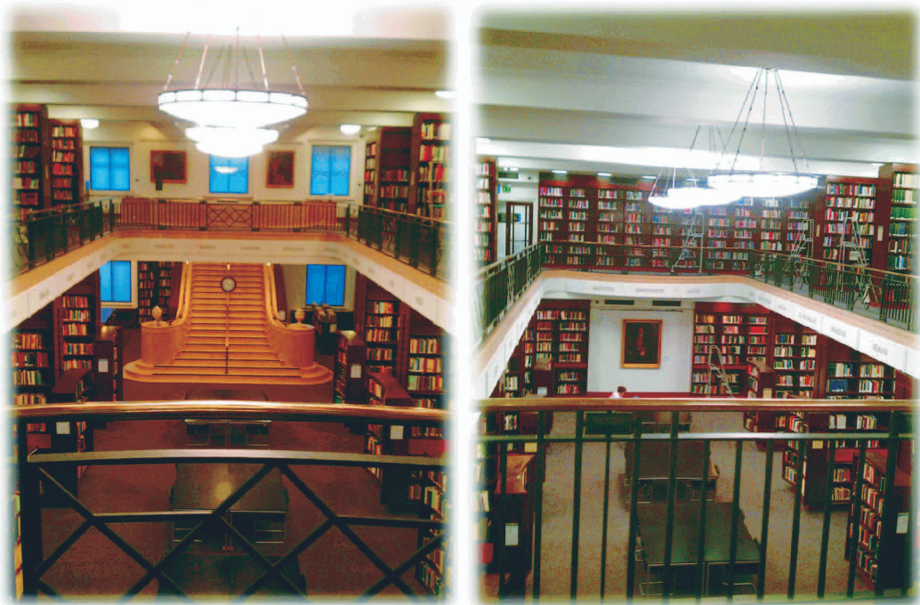
圖2：衛爾康醫學史圖書館內，氣派的閱覽室大廳。2013年元月24日攝。

跟大英圖書館比較起來，衛爾康醫學史圖書館（Wellcome Library）算是個新的私人圖書館（1913 創館），專門收藏醫學史，及相關的社會醫療書籍與檔案。十九世紀中葉，英國傳教士透過醫療傳道，到廈門、臺灣佈教，所以該館有些相關的檔案收藏。去年（2012）高雄美術館曾針對館藏中的臺灣老照片，邀集該館的館藏到臺灣，做「波光流影」世紀影像特展。