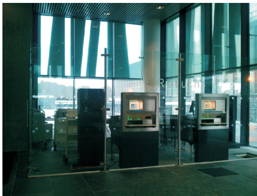
圖6：自動還書區，猶如自動櫃員機，讀者只需將書放在入口，書籍就會隨輸送帶送至電腦刷退，再依不同書號分送至各書籃中。2013年元月15日攝。

走進一樓大廳，以中間的接待櫃臺為分際，一邊是咖啡簡餐區、一間展覽室、公用電腦區，以及一小間書籍卡片販賣部、自動還書區（圖6）、影印室及電腦查詢區；另一邊則是刷卡才能進入的圖書館各樓層入口。特別的是地上七層建築，以立體螺旋中庭貫串其間（圖7），讓大門入口內的視野，直達天際，也讓日光可以直接照射到一樓大廳（圖8）。