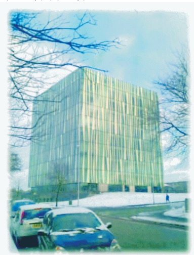
圖4：2012年成為亞伯丁新地標的「鄧肯萊斯公爵圖書館」（Sir Duncan Rice Library）。2013年元月15日攝。

事實上，這棟斥資新臺幣 26.6 億元興建的九層樓圖書館（圖 4，地上八層，地下一層），全名「鄧肯萊斯公爵圖書館」（The Sir Duncan Rice Library），2005 年開始設計，2009 年動土，雖然建築物本身在 2011 年夏天已完工啟用，卻直到去年（2012）九月，等建築物外的景觀整理完成後，才邀請登基六十週年的英國女王，隆重舉行正式的開幕儀式。自此，這棟由 760 片玻璃帷幕圍繞的圖書館大樓，已成為亞伯丁的著名地標之一。