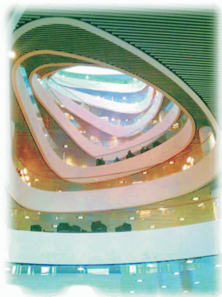
圖7：從圖書館大門入口的中庭向上仰望，視野直達天際。2013年元月15日攝。

走進一樓大廳，以中間的接待櫃臺為分際，一邊是咖啡簡餐區、一間展覽室、公用電腦區，以及一小間書籍卡片販賣部、自動還書區（圖6）、影印室及電腦查詢區；另一邊則是刷卡才能進入的圖書館各樓層入口。特別的是地上七層建築，以立體螺旋中庭貫串其間（圖7），讓大門入口內的視野，直達天際，也讓日光可以直接照射到一樓大廳（圖8）。