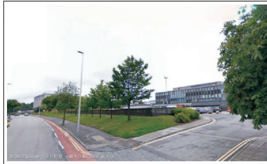
圖3：2008年圖書館興建前。

事實上，這棟斥資新臺幣 26.6 億元興建的九層樓圖書館（圖 4，地上八層，地下一層），全名「鄧肯萊斯公爵圖書館」（The Sir Duncan Rice Library），2005 年開始設計，2009 年動土，雖然建築物本身在 2011 年夏天已完工啟用，卻直到去年（2012）九月，等建築物外的景觀整理完成後，才邀請登基六十週年的英國女王，隆重舉行正式的開幕儀式。自此，這棟由 760 片玻璃帷幕圍繞的圖書館大樓，已成為亞伯丁的著名地標之一。