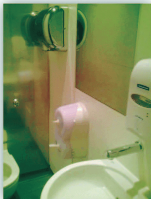
圖5：館內所有廁所用。都來自雨水。 2013年元月15日攝。