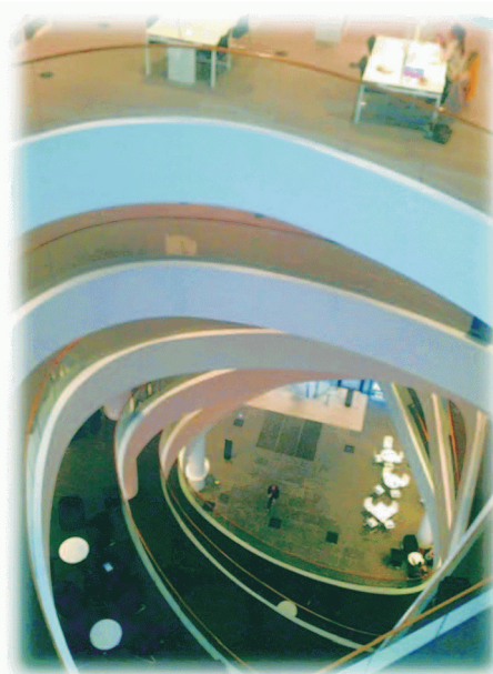
圖8：從頂樓俯視中庭，可見明亮、寬敞的一樓大廳。每一層樓的各式桌椅，可依個人閱讀需求，自由移動。2013年元月17日攝。