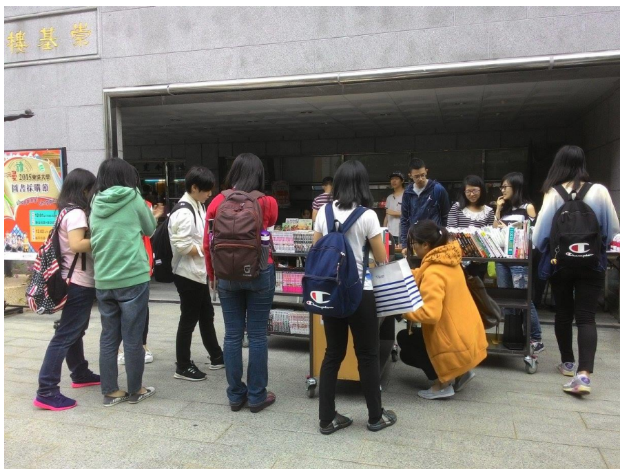
【城中校區--圖書採購節活動剪影】

最受師生喜愛的「你挑書我買單」活動，往年多以現場挑選圖書薦購為主，今年技術服務組特地邀請廠商至現場擺攤並且提供購書優惠，同時東吳漫畫學社則將社團內或個人珍藏公仔借出展覽與漫畫塗鴉，現場熱鬧有趣，這便是如同嘉年華般的「2015 圖書採購節」。