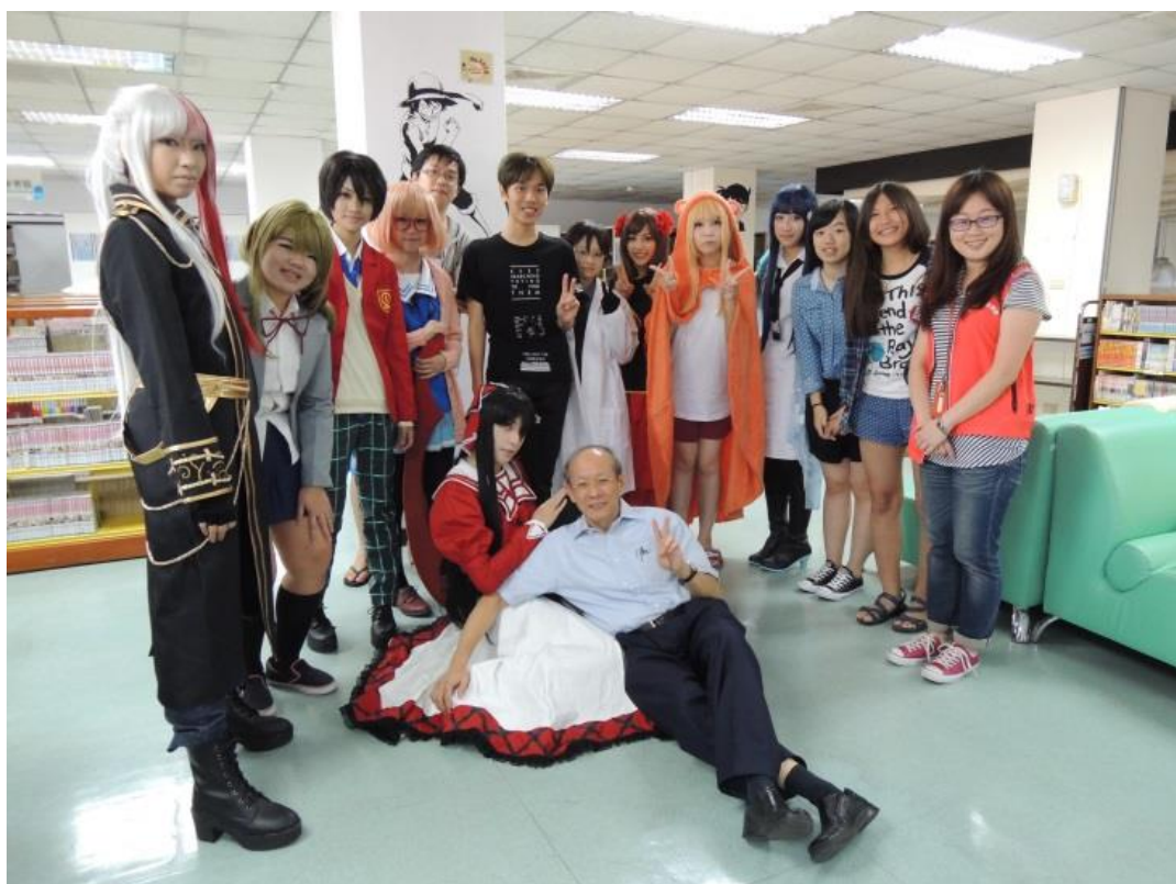
【圖一：「COSPLAY·攝影會」活動剪影】