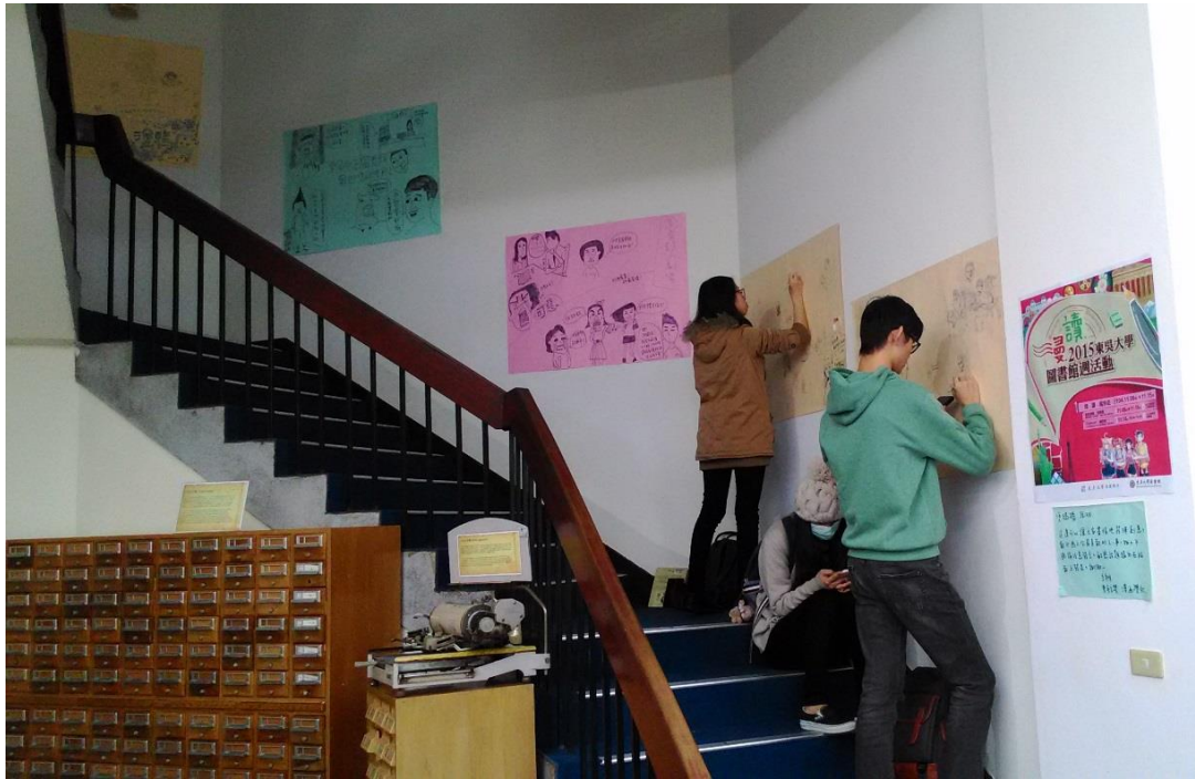
【學生在迴旋樓梯上作畫的情形】