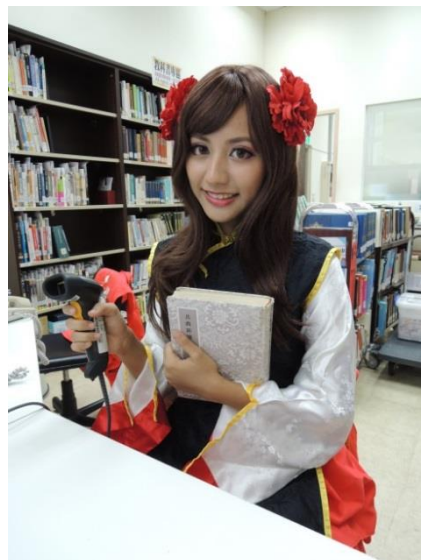
【圖二：圖書館服務櫃台以COSPLAY風格提供借還書服務，增添多元服務風貌】

感謝本校漫畫學社社員全力投入11月份熱身的活動「迴旋漫舞·塗鴉牆」、 「COSPLAY·攝影會」。其中11月15日(日)舉辦的「COSPLAY·攝影會」活動當日有多位本校同學、漫畫學社社員、畢業校友、日本交換生以及其他對COSPLAY有興趣的朋友們，為圖書館漫讀區注入活力，記錄自己精彩的一刻！當得知有些COSPLAY服裝是不假手他人，一針一線獨力車縫完成時，圖書館由衷對這群學子們湧現敬意與佩服，這種實現自我興趣、獨立完成的精神，將陪伴這群孩子們的人生，一起發光！（圖一）圖書館服務櫃台當日亦以COSPLAY風格提供借還書服務，增添活動氛圍與多元服務風貌（圖二），活動當天造成不便之處，圖書館亦感謝師生對多元文化的尊重與體諒，本次活動照片於東吳社群臉書上獲得1349位同學點讚，迴響熱烈！下學期圖書館將推出更精彩的COSPLAY活動，敬請期待。