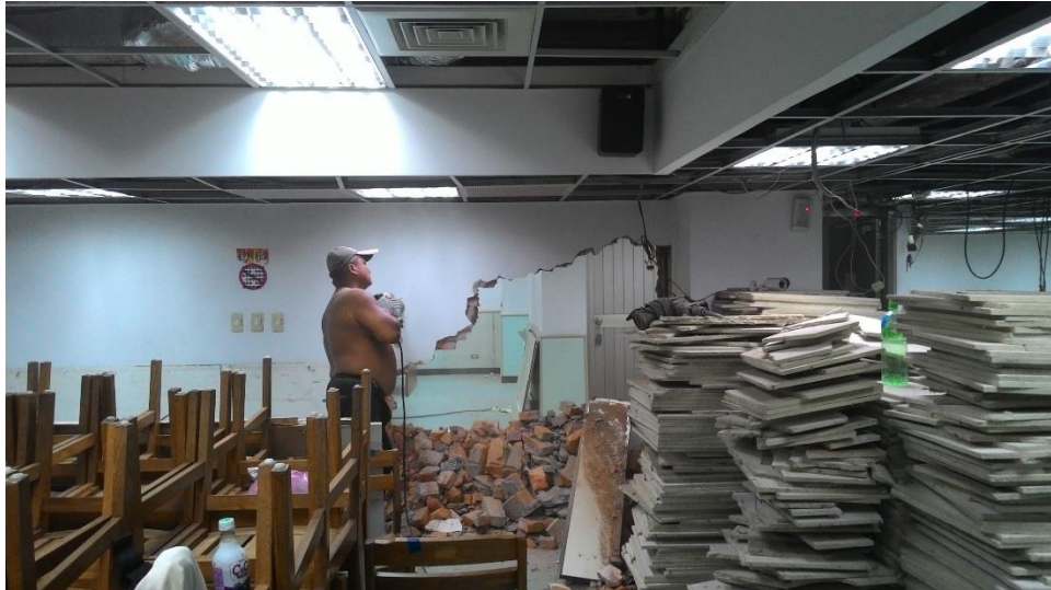
【20160822 拆除 A 區磚牆】