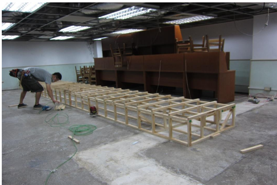
【20160908 卡式座椅骨架製作】

2016年9月5日(一)起開始進行牆面水泥漿粉光、地面回填補平、插座移位拉線、電源迴路查修、監視系統裝配管線、卡式座椅骨架製作和走廊牆壁封版等工程。為解決第一閱覽室空氣不流通沉悶的問題，增設三台多翼離心式雙吸口箱型風機和一台落地立式預冷空調箱。另因應消防法規，加裝三台排煙機，因東側一樓排煙管路開孔處就在法律系辦公室內部，經過幾次現勘協調，利用9月10日(六)施作，避免影響法律系辦公室運作。