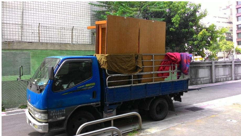
【20160822 運送報廢六人桌至雙溪校區】

連休長假之後，總務處和法學院對於崇基樓樓管安全有所質疑，主因是 B1 廁所拆除之後，同學就要利用一樓的廁所，但能上到一樓，就代表可以在大樓內各層樓通行無阻，但閱覽室開放時間比大樓大門關閉時間還長，在週一至週五 22 點之後、週六日及例假日，甚至期中和學期考試 24 小時開放，在樓管安全上可能會出現問題。經過圖書館和總務處協商之後，在 2016 年 9 月 5 日(一)向法學院提出「崇基樓門禁管理配套措施草案」，配合崇基樓「週一至六」22:30 大門關閉，閱覽室「週一至週五」縮短開放至 22:30，「週六」維持現行開放至 22:00，「週日」因崇基樓 17 時會關閉大門，圖書館建議兩方案，其一是宣導同學到第二大樓或第五大樓使用廁所，另一則是崇基樓不管制，允許同學使用一樓的廁所。考試期間 24 小時開放，依據歷年來觀察，過了深夜 12 點之後，人數大致都不超過 30 人，