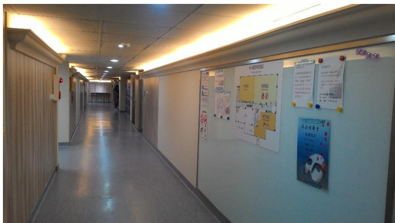
【20161228 第一閱覽室中央走廊】