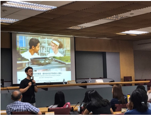
【水尤，從電影，找回面對世界的勇氣】

2.10 月 17 日(二)城中校區：「啾啾鞋」，「要“你管”，一個理工宅的 YouTuber 之路」。