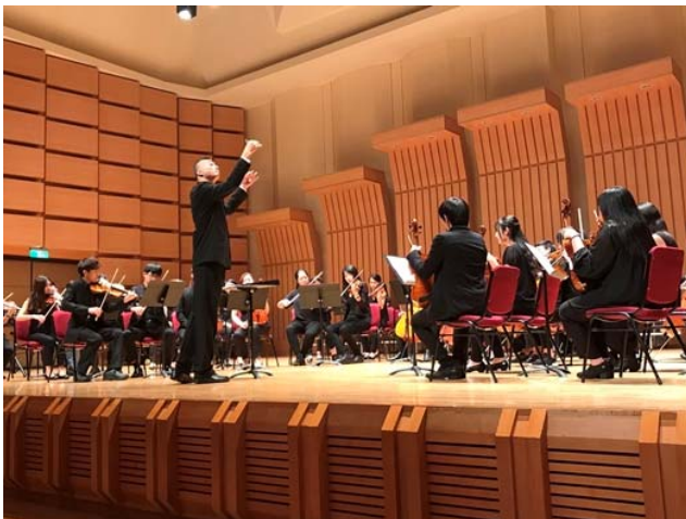
【「上主是我堅固堡壘」音樂會】