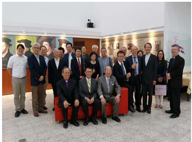
【紀念展揭幕典禮貴賓合影】