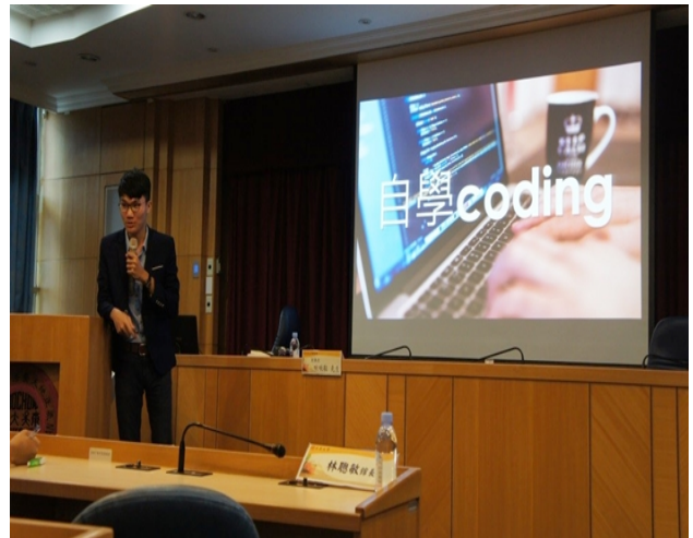
【啾啾鞋，要“你管”，一個理工宅的 YouTuber 之路】