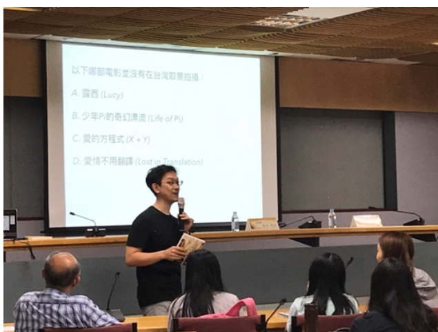
【水尤，從電影，找回面對世界的勇氣】