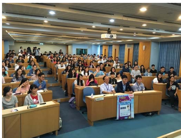
【啾啾鞋，要“你管”，一個理工宅的YouTuber之路】