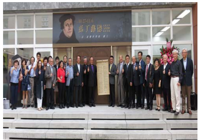
【紀念展揭幕典禮貴賓合影】