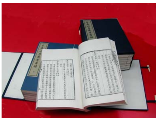
山東大學所贈之玉函山房藏書簿錄 (複製本)

考與推廣等相關業務運作進行認識與瞭解，對於兩岸圖書資訊環境與未來發展，諸如，著作權的看法、閱覽服務、博碩士論文資料庫的建置、讀者網路環境的需求，館際合作，以及館員培訓計畫.....等，雙方交換意見，達成許多共識。