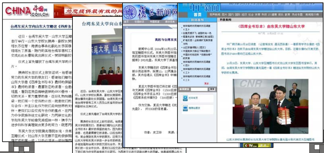
大陸電子媒體紛紛報導本校與復旦、山大之贈書儀式