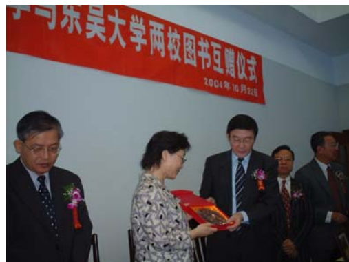
丁原基館長與復旦大學徐忠副校長互贈禮物