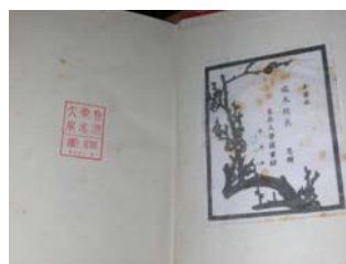
山東大學圖書館為四庫珍本加蓋的贈書章

藏地。圖書館於四樓古籍部特闢『第三特藏閱覽室』專室，特別訂製全新書櫥以典藏、陳列此套珍本，並加蓋贈書章以詮釋兩校圖書資源互贈的情誼。