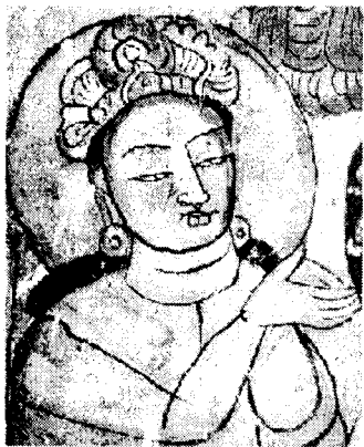
炳靈寺169窟 供養菩薩