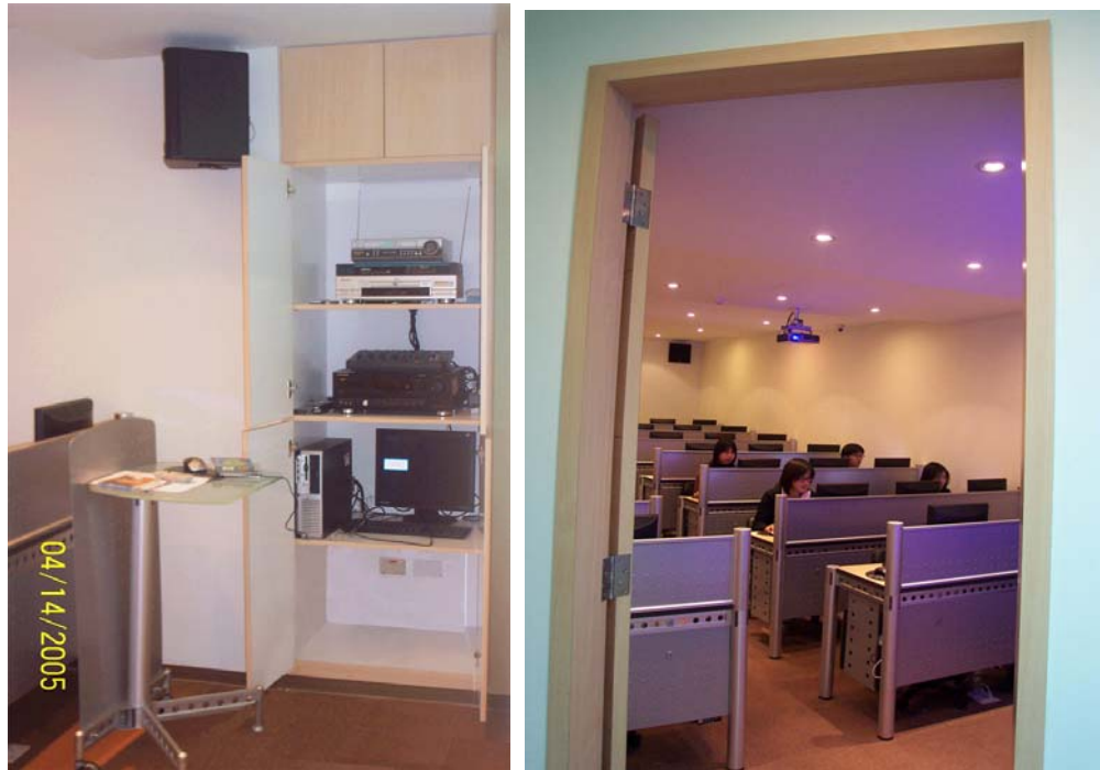
專業級多媒體播放系統,可播製教師自製的教材,或利用網路上多媒體資源來輔助教學,聲光效果兼備,必可大大提昇學習成果。