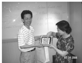
【課程結束後，館長致贈本館紀念品】