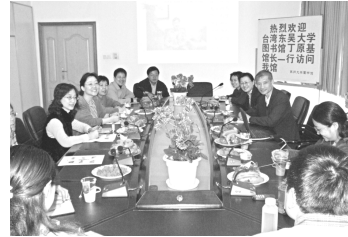
【與蘇州大學圖書館意見交流】

雙方館長同聲表示圖書館之合作，應是細水長流，兩館將在現有的共識之下，秉持為兩校師生爭取更多資訊資源，全面開展館際合作交流之業務，以支援教學，共創雙贏之局面。參訪期間，本館致贈本校出版品及紀念品予蘇大圖書館，蘇大白倫副校長亦回贈本館《中國絲綢通史》一書。（該書由蘇州大學出版社出版，835面，被評選為“2005年全國文博考古十佳圖書”）