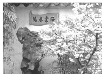
【海棠春邸右邊即是海棠】

園中海棠盛開，爭奇鬥豔，它與臺灣栽種在花盆的海棠不同，是整株種在地上，比人還高，算是增長了見識。