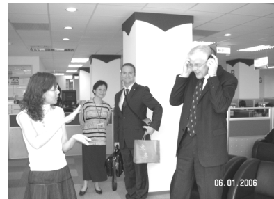
【澳洲邦德大學 Robert Stable 校長等 2 人參訪本館】