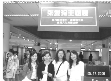
【本館同仁至銘傳大學圖書館參加張愛玲主題展】

由於95學年度圖書經費減少約一千三百萬元，因此委員會附帶決議：「圖書館委員會請圖書館館長於校務會議、行政會議等場合表達下列意見」：