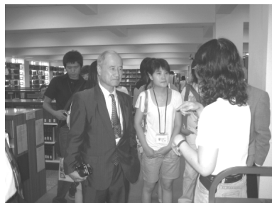
【大一新生家長參訪分館】