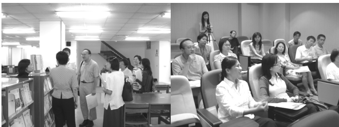
【新進教師研習營參訪本館】