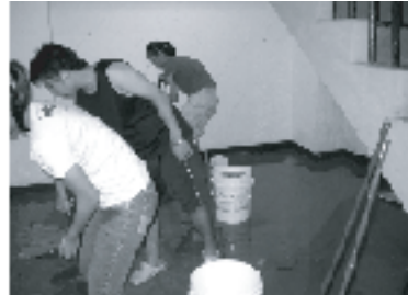
【1B至2B安全梯轉角處淹水約10公分抽水情形及清除泡沬污損物】