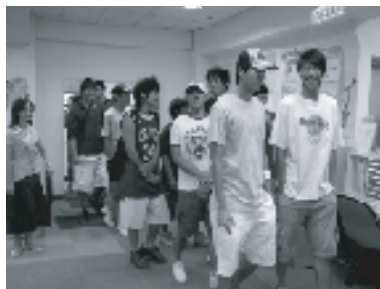
【高雄師範大學籃球隊17位同學參觀城區分館】