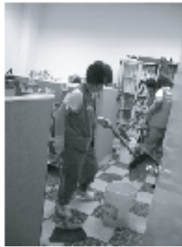
【館內同仁、工讀生、保潔清潔人員全力配合及營造廠商派員協助本館完成清潔善後工作】