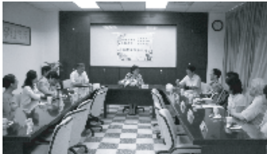
【蘇州大學圖書館與本館同仁交流座談】