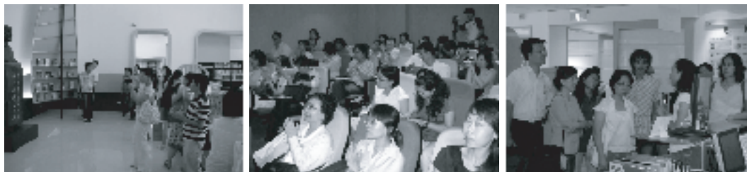
【『東吳大學圖書館非書資料管理系統建置經驗分享座談會』圖書館界同道參觀本館及分享座談會照片】