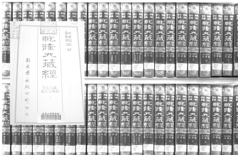
《乾隆大藏經》：中正圖書館館藏 221.08 0024

對於以基督教辦學的學校，圖書館竟收有如此豐富的佛學藏書萬餘冊，幾已達成立一宗教系所之水平，希望藉由本文的介紹，願如此豐富的佛學文獻，提升東吳師生研究佛學的興趣，並祈得到學習的法喜充滿。