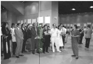
【參觀民眾年齡層橫跨老中少三代皆深受拓片展覽作品吸引】