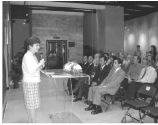
【馬君梅副校長致詞】