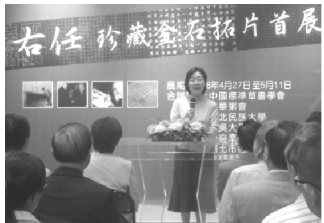
【本館丁原基館長致詞】