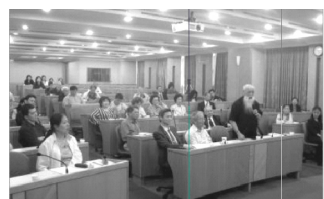
【座談會觀眾與座談人互動熱烈，發表精闢見解】