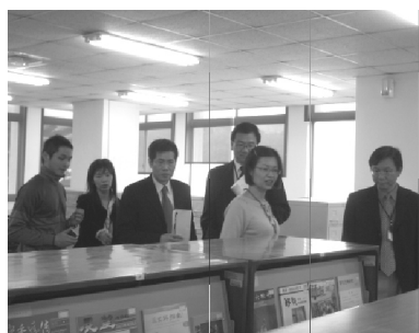
【政治系評鑑委員蒞館訪評】