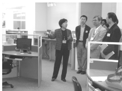
【中文系評鑑委員蒞館訪評】