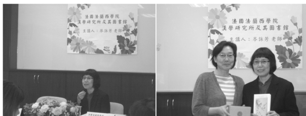
【本館致贈圖書館鄒一桂花鳥明信片與東吳大學杯組紀念品】