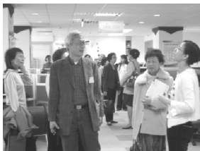
【校友回娘家參觀中正圖書館情形】