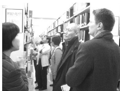
【德文系評鑑委員蒞館訪評】