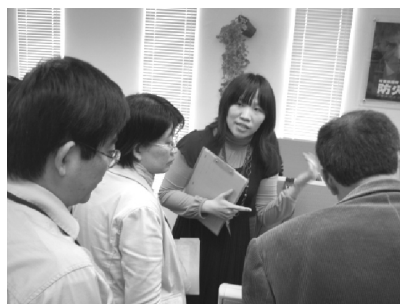
【經濟系評鑑委員蒞館訪評】