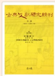
古典文獻研究輯刊