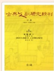
古典文獻研究輯刊