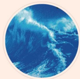
中國現當代文化與 文學研究系列