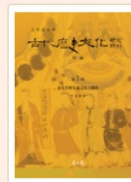
古代歷史文化研究輯刊