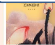
古典文學研究輯刊