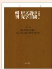
中國語言文字研究輯刊