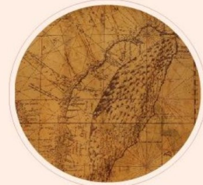
臺灣歷史與文化 研究輯刊

研究論題涵蓋有：政治史研究、經濟史研究、社會與文化研究、宗教與文化研究、思想與文化研究、藝術與文化研究、教育與文化研究、原民族群與文化研究、語言與文化研究、地方歷史與文化研究、清代與現當代台灣文學與文化研究。