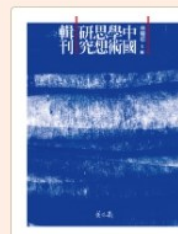
中國學術思想研究輯刊