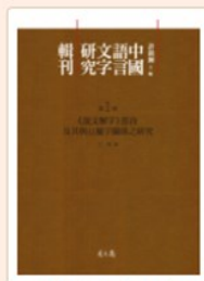
中國語言文字研究輯刊