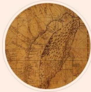
臺灣歷史與文化 研究輯刊