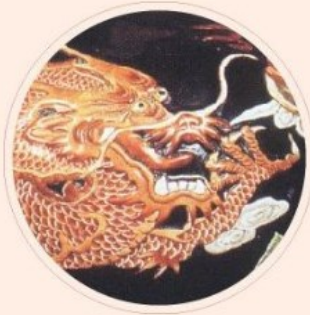
中國傳統文化 研究系列