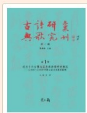
古典詩歌研究輯刊