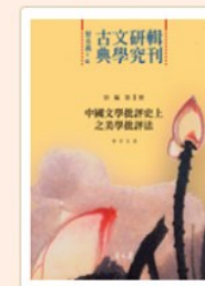
古典文學研究輯刊