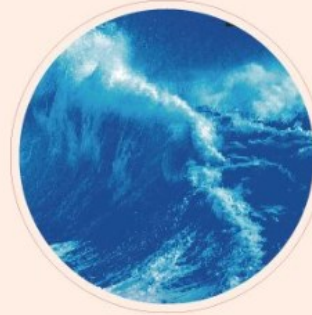
中國現當代文化與 文學研究系列

本公司係由兩岸學者協同主編的學術出版社，出版品為各大學教授推薦之博士論 多年來已出版了涵蓋文史哲各個學門的學術專著數千部，書系二十餘種， 作者遍及兩岸老中青三代學者，形成了一個完整而重要的學術研究大庫。