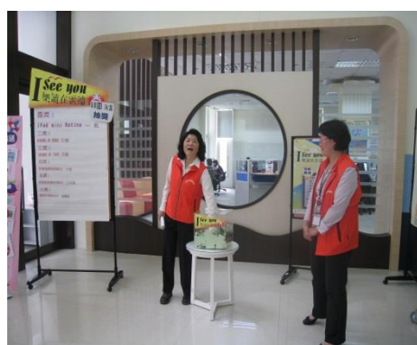
【於中正圖書館大廳公開抽獎】

凡參與本校423世界書香日系列活動即可獲得摸彩券一張，參加越多中獎機率越高，最大獎的ipad mini於5月8日由前總統李登輝先生為我們公開抽獎，由企管系陳怡伶同學獲得該項大獎，其它的獎項，如：USB隨身碟、家樂福禮券200元、全家禮券100元，以及影印卡等多項好禮也隨後公開抽出，並發送email通知及公告於圖書館網頁及校園海報欄。