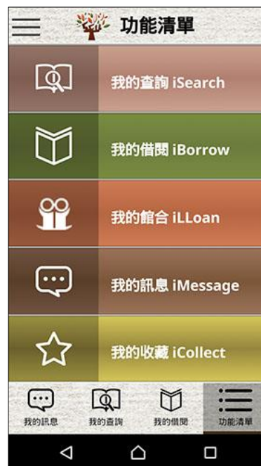
【圖二 APP 功能清單】