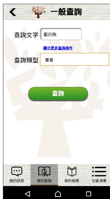
【圖三 我的查詢選單】