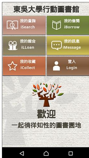
【圖一 APP 首頁】