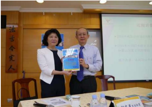
【圖書館感謝前館長演講】