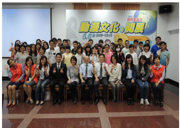
【「動漫文化之開展」演講參與者大合照】