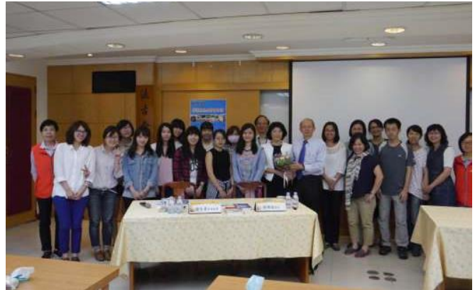
【「話說東吳大學圖書館」演講活動會後合影】