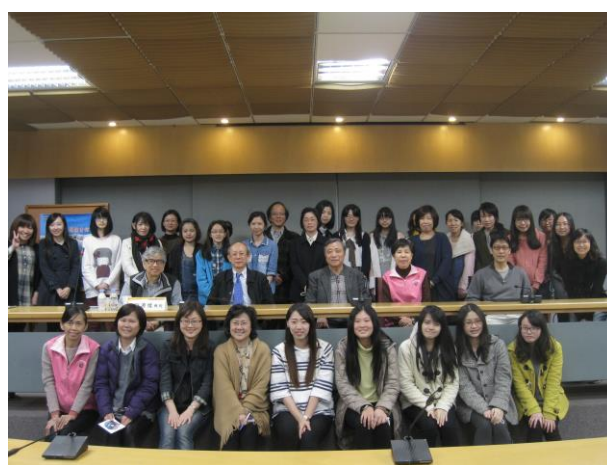
【「話說東吳大學圖書館」演講活動會後合影】