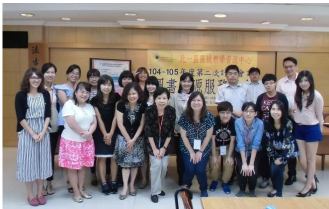
【各夥伴學校同道合照】