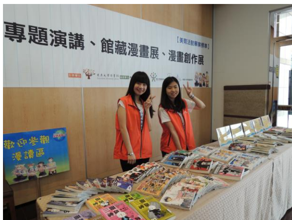
【左圖漫畫展擺攤狀況】