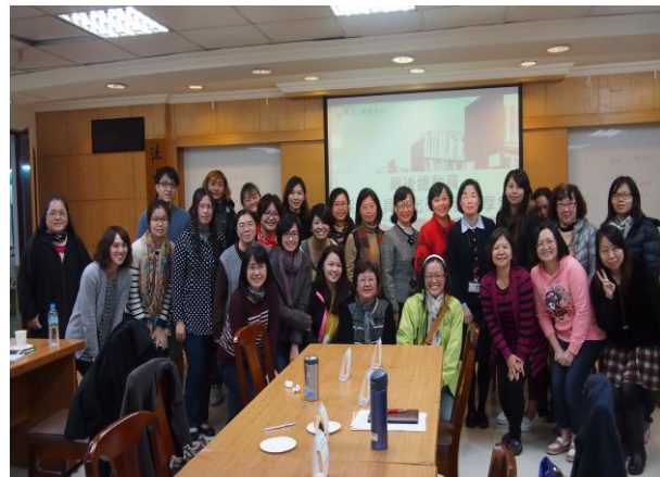
【實務分享會全體大合照】