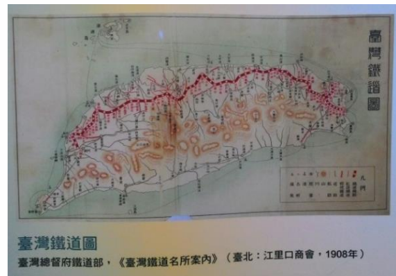
【右圖：1908 年臺灣鐵道圖】

展覽期間，吸引數百位同學駐足瀏覽，有同學看到一幅 1908 年的「臺灣鐵道圖」，臺灣是用橫躺來呈現，表示還蠻少見