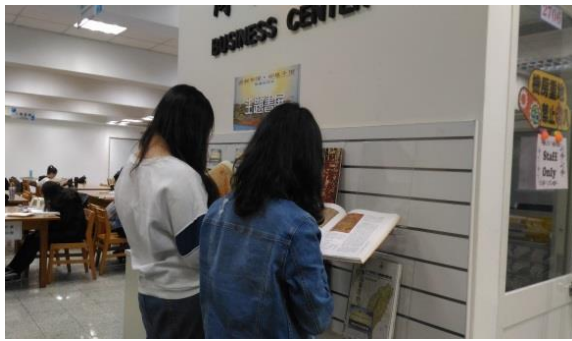
【同學參觀主題書展】