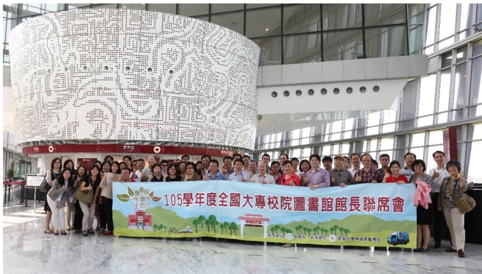
【故宮南院大廳內合照】

夥伴們！動起來吧！讓我們搭起一座知識的橋樑，串聯全校師生與圖書館之間的連結，扭轉師生對圖書館的想像，並用對的工具，在對的管道，給對的人，使得讀者自然而然的愛上圖書館，共同延續圖書館永恆的生命。