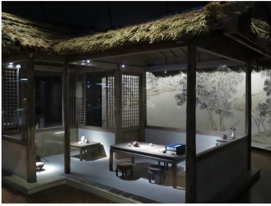
【故宮南院_明朝文人品茗茶屋】