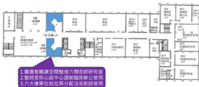
第二大樓 6 F 平面圖 (現況vs未來)

108 年 6 月 18 日(二)上午 9 時於城中校區 2123 會議室召開「城中校區地下餐飲空間異動及調整說明會」，分館 6 樓書庫空間預計隔成六間教師研究室，將暫時提供學生事務處健康暨諮商中心調節臨時辦公使用，等六大樓各單位就位再分配法商教師使用(如右圖)。