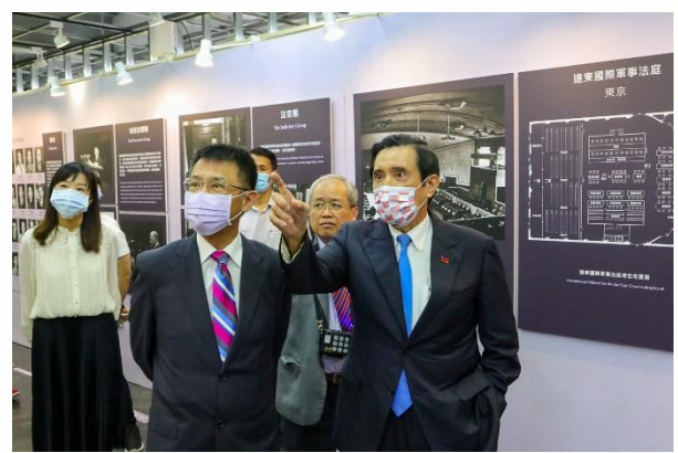
【政治系謝政諭教授親自帶領貴賓進行導覽】