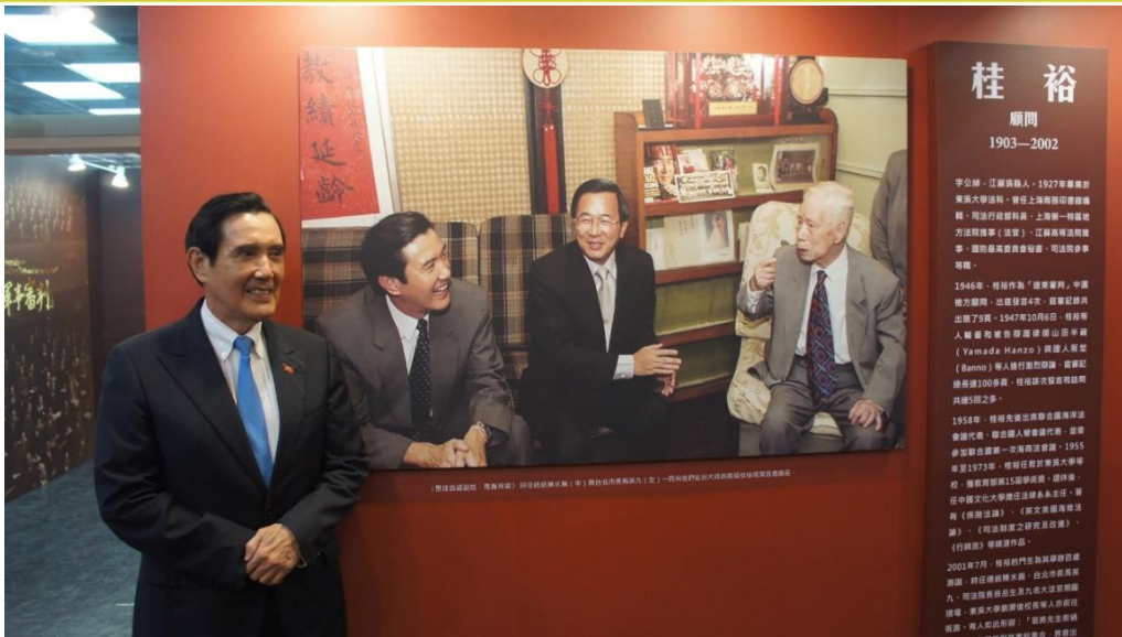
【馬前總統 2001 年擔任台北市長與時任總統的陳水扁和恩師桂裕合影照片】

戰爭是一場浩劫，雖有勝敗，其實並無贏家。戰後審判戰犯，固然在於懲罰，而其積極意義，是要重建國際秩序，並維繫人類自由、民主與和平的價值。東吳大學舉辦『東吳人與「遠東國際軍事審判」圖片展』之目的，非以批判或譴責作主軸，而係冀望在校師生們能透過此展覽，對東吳大學校友的貢獻能有進一步的認識與啟發，繼而培養關心歷史、政治與文化，並具有獨立思考能力的東吳人。