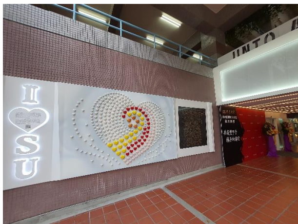
【「東吳懷恩數位校史館」感謝牆】

校史館的啟用，象徵著一段新的里程的開始，未來，真心地希望在「東吳懷恩數位校史館」園地裡，我們能常常看到您的蹤影，因為，它將不僅只是一座校史館而已，它將溫暖而堅定地為東吳點燈，傳承東吳精神，讓全校師生、校友及社會人士都可以感受到東吳大學 120 年歷史的魅力所在！更期望它能成為海內外所有東吳人弦歌悠揚，心之所繫的娘家。