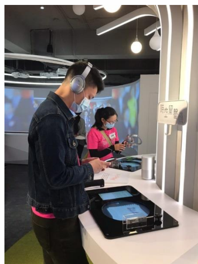
【「東吳懷恩數位校史館」啟用後，由左至右學生參觀情形：「回憶東吳」區、「學院 lucky 球」區、「聲音森林」區】