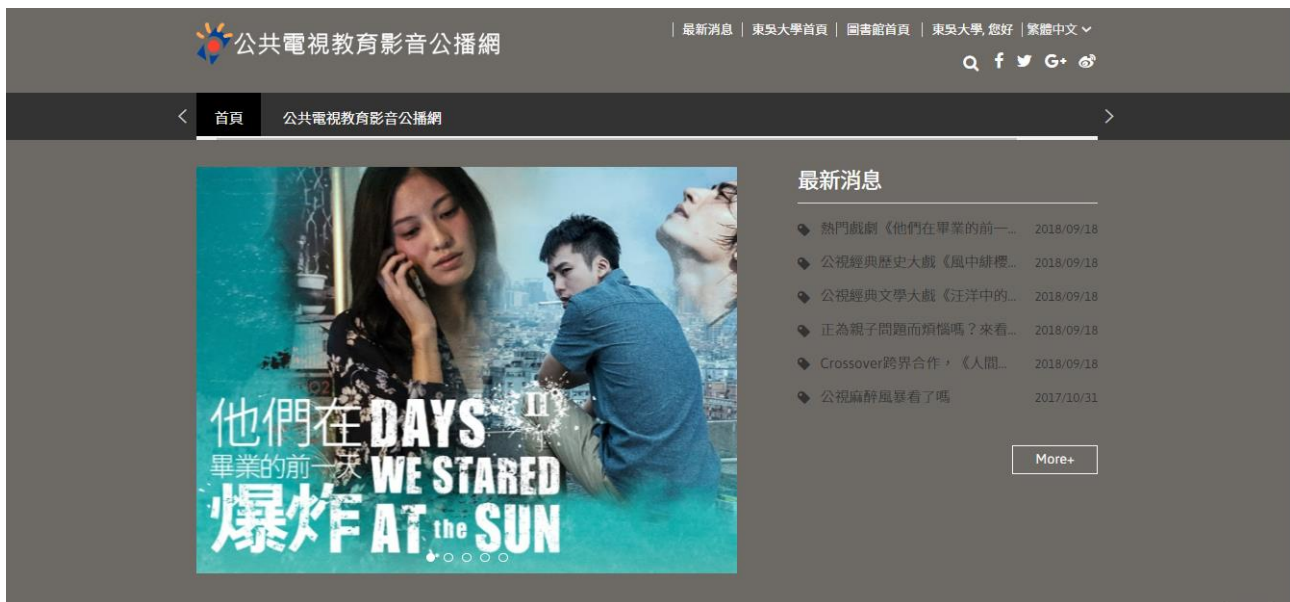
【「公共電視教育影音公播網」平台首頁】