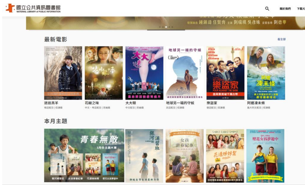
【教室電影院公播大平台】

(二)「 教室電影院公播大平台 」為全國性使用公播版電影線上串流的平台，可合法觀賞具教育意義的電影。除了個人雲端觀看外，若為全國中小學教師，此資源可做為課堂教學播放之非商業用途使用。唯不可透過此平台直播及轉播。2022 年已有 184 部影片可供觀看。