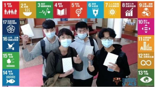
【10 月 25 日於寵惠堂舉辦「SDGs 超前部署書展」一日快閃活動】