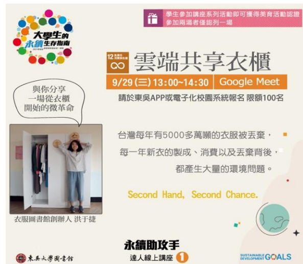
【「永續助攻手-雲端共享衣櫃」講座海報】

「每次消費，都在決定我們未來的社會」，期待透過本次講座，讓更多人認識永續生活議題，不只二手衣再利用，生活中各方面也能支持永續環境，養成負責任的消費型態。如欲對SDGs 指標12「負責任消費與生產」有更全面的認識，推薦您閱讀《啟動循環經濟》，一同了解循環經濟的內涵與實踐方式！另外，17項指標之館藏與電子書，均可透過 https://www.lib.scu.edu.tw/sdg/SDGs_B.html 綜覽，歡迎借閱。