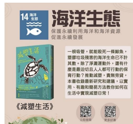
【SDGs17 項指標館藏《減塑生活》】