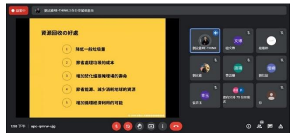
【永續助攻手-必修的一堂垃圾課講座畫面】