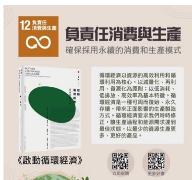
【SDGs12 推薦圖書《啟動循環經濟》】