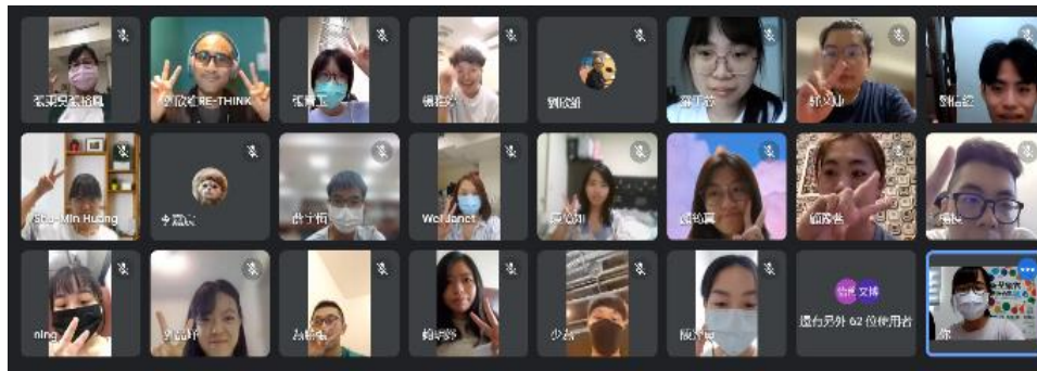
【10月13日「永續助攻手 II-必修的一堂垃圾課」線上講座大合照】

新鮮人求生包參與人次共計 94 人，獲得活動消息管道依次為「郵件公告」、「圖書館官網/臉書」及「師長推薦」，整體滿意度平均為 4.52，滿意度前三名為「活動內容可幫助學習利用圖書館資源」4.61、「未來願意善用圖書館資源充實自我」4.59、「活動內容可幫助瞭解圖書館提供的服務」4.57。回饋方面，新生認為利用短片可提前了解圖書館的環境及服務，可幫助快速進入狀況，有抽獎活動也可提升參與意願，另有關於影片的電子人聲聽久較不舒服之建議。