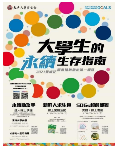
【「大學生的永續生存指南」主海報】

針對大學新鮮人，特別準備了【新鮮人求生包】數位課程影片與線上闖關活動，觀看圖書館數位學習室影片，於 google 線上表單答題闖關，經由關卡任務的引導，讓新鮮人們快速認識圖書館的各項資源服務，並抽取限量 50 份之 7-11 商品卡 100 元。