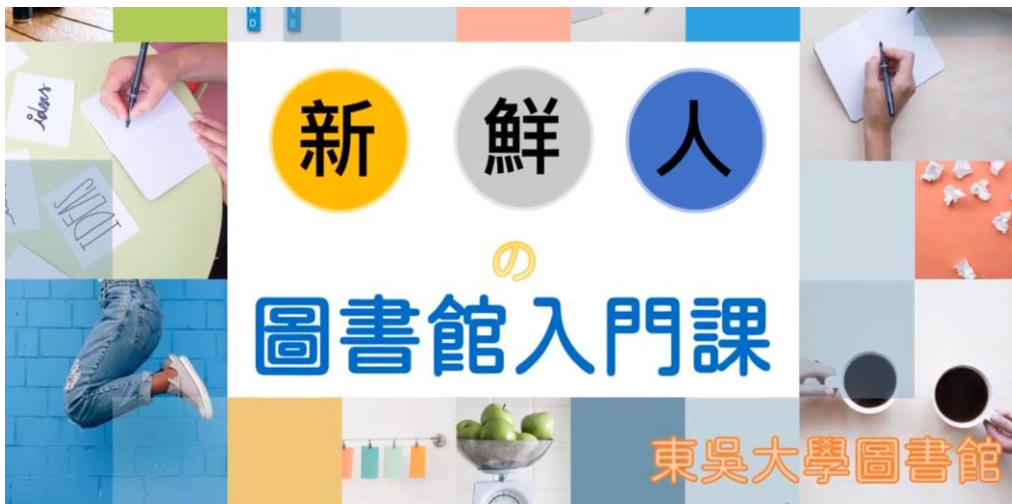
【新鮮人求生包數位課程影片】