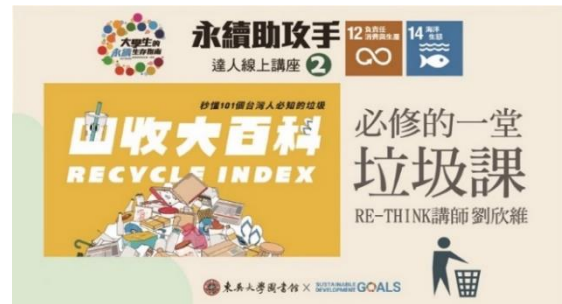
【永續助攻手-必修的一堂垃圾課宣傳海報】

海洋環境需要更多人關注，以減少海洋垃圾與增加循環經濟的可能。如欲對 SDGs 指標 14「海洋生態」有更全面的認識，推薦您閱讀《減塑生活》，一同了解海洋生態正面臨的浩劫，與人類如何與海洋永續共存！另外，SDGs17 項指標之館藏與電子書，均可透過 https://www.lib.scu.edu.tw/sdg/SDGs_B.html 綜覽，歡迎借閱。