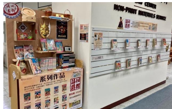
【本館《諸葛四郎》漫畫館藏，中正圖書館(左與右上)與城中分館(右下)展區陳列】