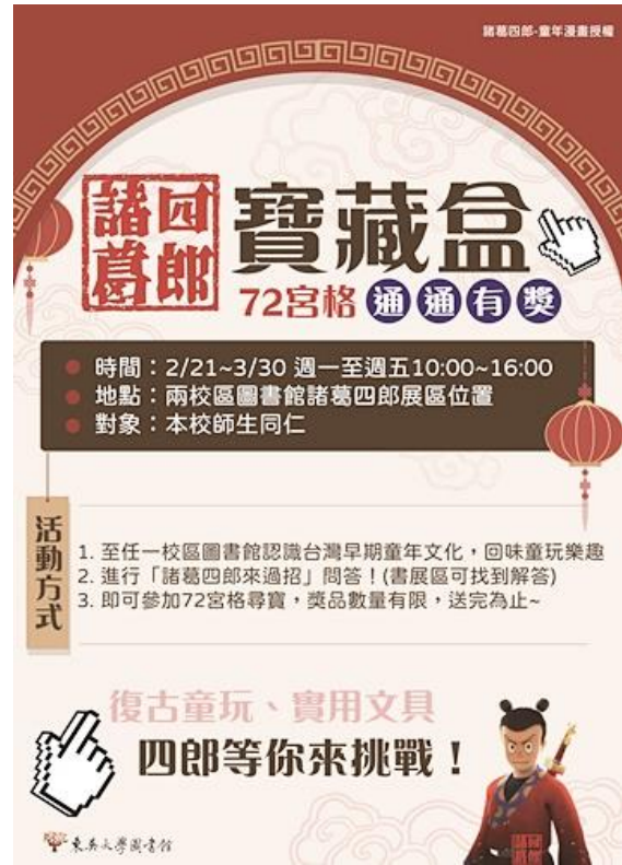
【「諸葛四郎 72 宮格的寶藏」活動花絮(左上)、童玩體驗區(左下)與宣傳海報(右)】