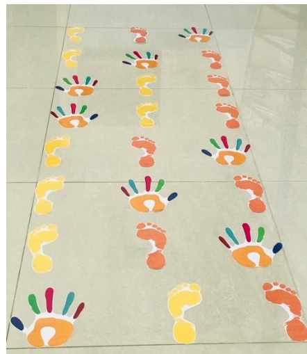
【館內實體書展布置】