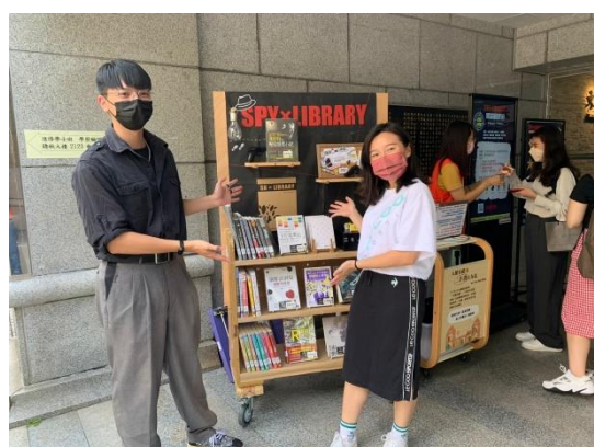
【城區第二大樓前書展快閃照片】