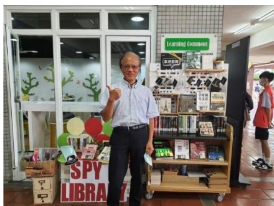
【雙溪舜文廳前書展快閃照片】