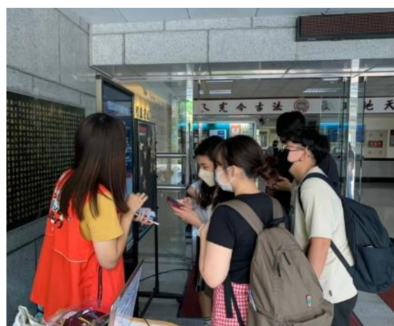
【城區二大樓前書展快閃照片】