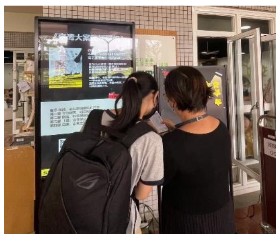
【雙溪舜文廳前書展快閃照片】