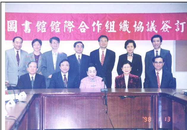
【圖 7 1998 年 1 月 13 日八芝連圖書館館際合作組織協議簽訂儀式】