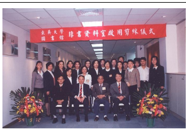
【圖 6 1994 年 3 月 12 日圖書館非書資料室成立】