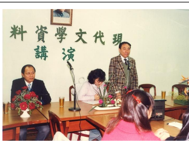
【圖 2 1986 年 3 月現代文學資料展演講】