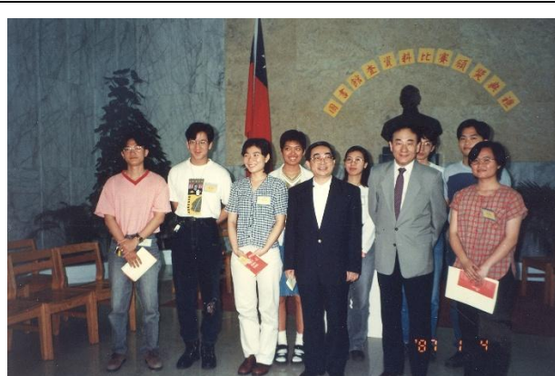
【圖 4 1987 年 1 月 14 日查資料比賽頒獎】