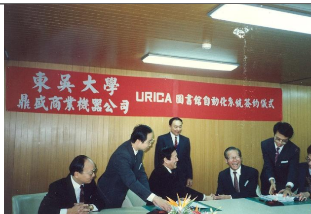
【圖 5 1991 年 1 月 18 日圖書館自動化系統 URICA 簽約】