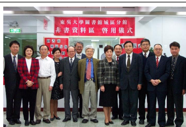
【圖 8 2001 年 11 月 1 日城區分館非書資料區啟用】