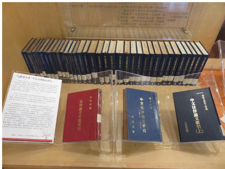
【圖 3 2016 年 3 月 14 日在外雙溪校區校史室舉辦「穿越圖書古道__再現歷史風華--本校在台復校以來圖書館變遷史」展場展示】