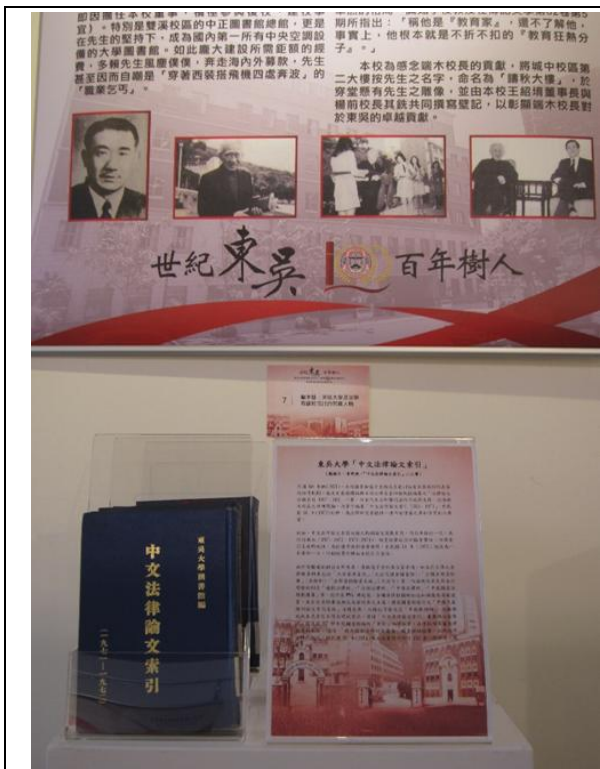
【圖 1 2015 年 5 月 18 日東吳大學法學院建院 100 週年院史展】