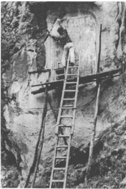
【製作宋代白水路摩崖拓片】

絲綢之路為起始於中原地區直通地中海沿岸呈網絡狀的交通大道，由於它在中國與西方各國間經濟文化的交流上，發揮了十分重要的功用，人們將之譽為中西方各族人民進行友好往來的「陸路橋樑」。