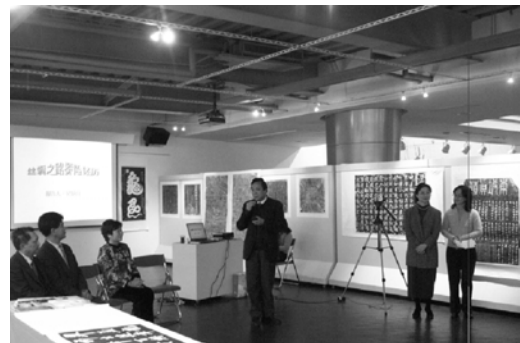
【台北市立教育大學校長劉源俊教授】