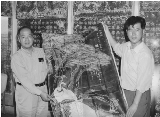
【與李政道博士合影】

就讀大學期間，曾騎自行車沿著絲綢之路進行為時近4個月的旅行考察。《中國青年報》、《甘肅畫報》等多家報刊雜誌都對其絲路之旅進行了宣傳報導，上海的